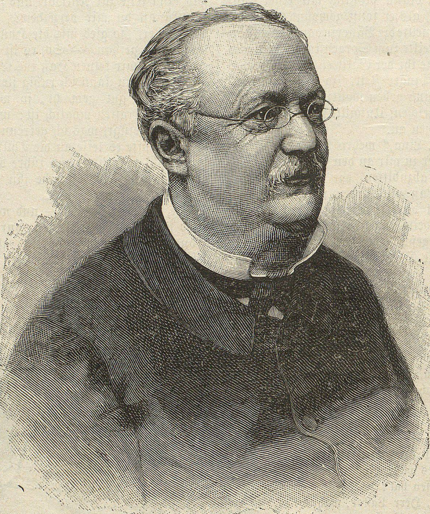
Konrad Ferdinand Meyer.

Wir dürfen aber auch mit Stolz auf unsere poetische Nationalliteratur blicken, denn sie ist zu allen Zeiten auf der Höhe der Entwicklung gestanden, welche die Literatur der großen Nachbarvölker jeweilen eingenommen hatte, und auch in der Gegenwart zählen schweizerische Dichter zu den ersten Vertretern der deutschen und französischen Dichtkunst. Unter den deutsch-schweizerischen Dichtern der Jetztzeit sind es besonders zwei, deren Namen man kennt und in Ehren nennt, soweit die deutsche Zunge klingt,