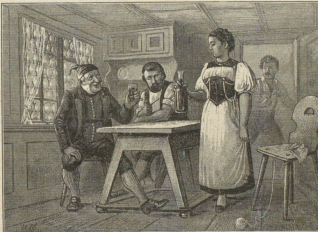
Was mußte der wohl denken, wenn er sein Lieb mit dem reichen, heirathslustigen Wittmann so vertraulich thun sah?

zogen und könnet Euer Muß und Brod selbst verdienen, wenn's mir schon, besonders um Dich, in dieser Beziehung tiefen Kummer verursacht. Nein Lina, Du sollst schließlich Deinen eigenen Willen haben, so sehr der Fritz drängen und bringen mag. Aber jetzt komm einewäg herunter und mache wenigstens Gesundheit mit ihm; denn gerade extra vor den Kopf zu stoßen mit Deinem Eigensinn, das brauchst Du den empfindlichen Feldbergbauer doch nicht; wir dürfen nicht ver-