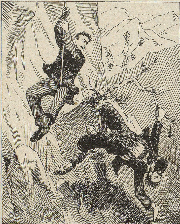
Lautlos stürzte der hochherzige Retter in den unermesslichen Abgrund.

* * * Am folgenden Morgen brachten Hirten Tonis sonderbarer Weise wenig zerfallenen Leichnam in's Kurhaus. Um die Züge des Todten spielte ein seliges, zufriedenes Lächeln, und seine geschlossene Hand barg eine schwarz und blaue Schleife, die er bei seinem letzten Abschied unbemerkt aus Berthas Haaren gelöst.