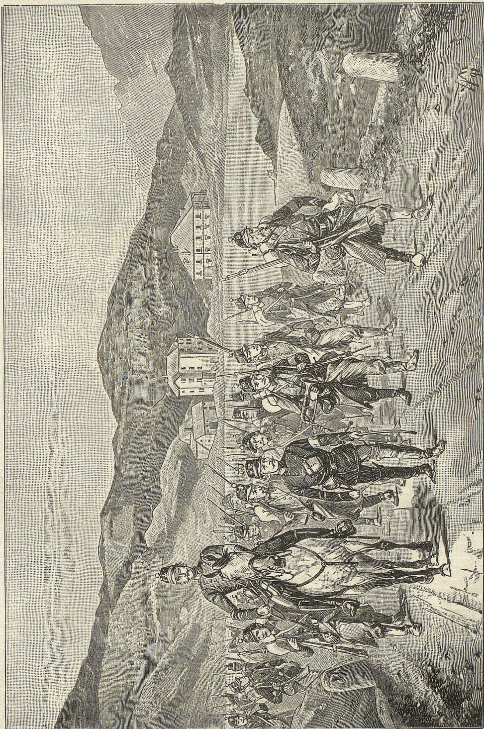
Infanterie auf dem Marsch über das St. Gotthard-Gospitz.