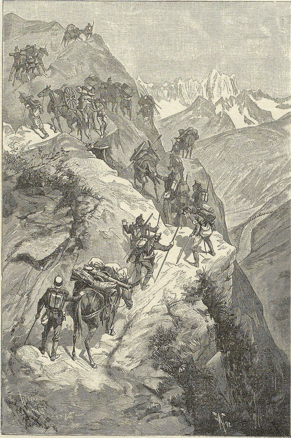
Gebirgsartillerie auf dem Marsch (Blick auf die Furkastraße).