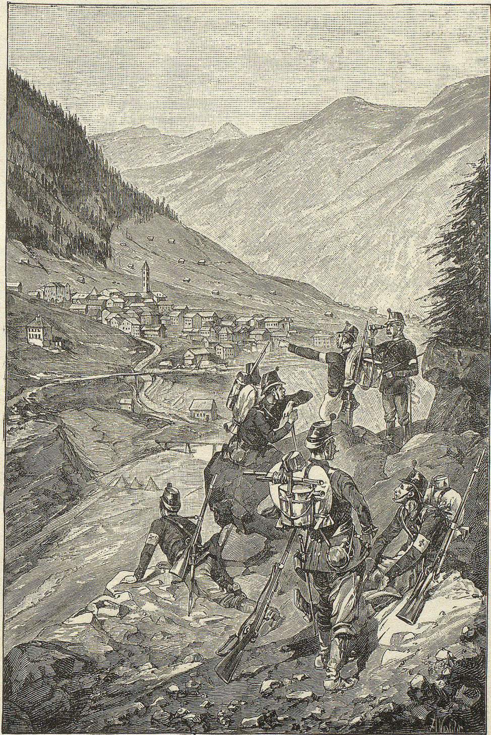
Rekognoszirende Schützen bei Tirol.