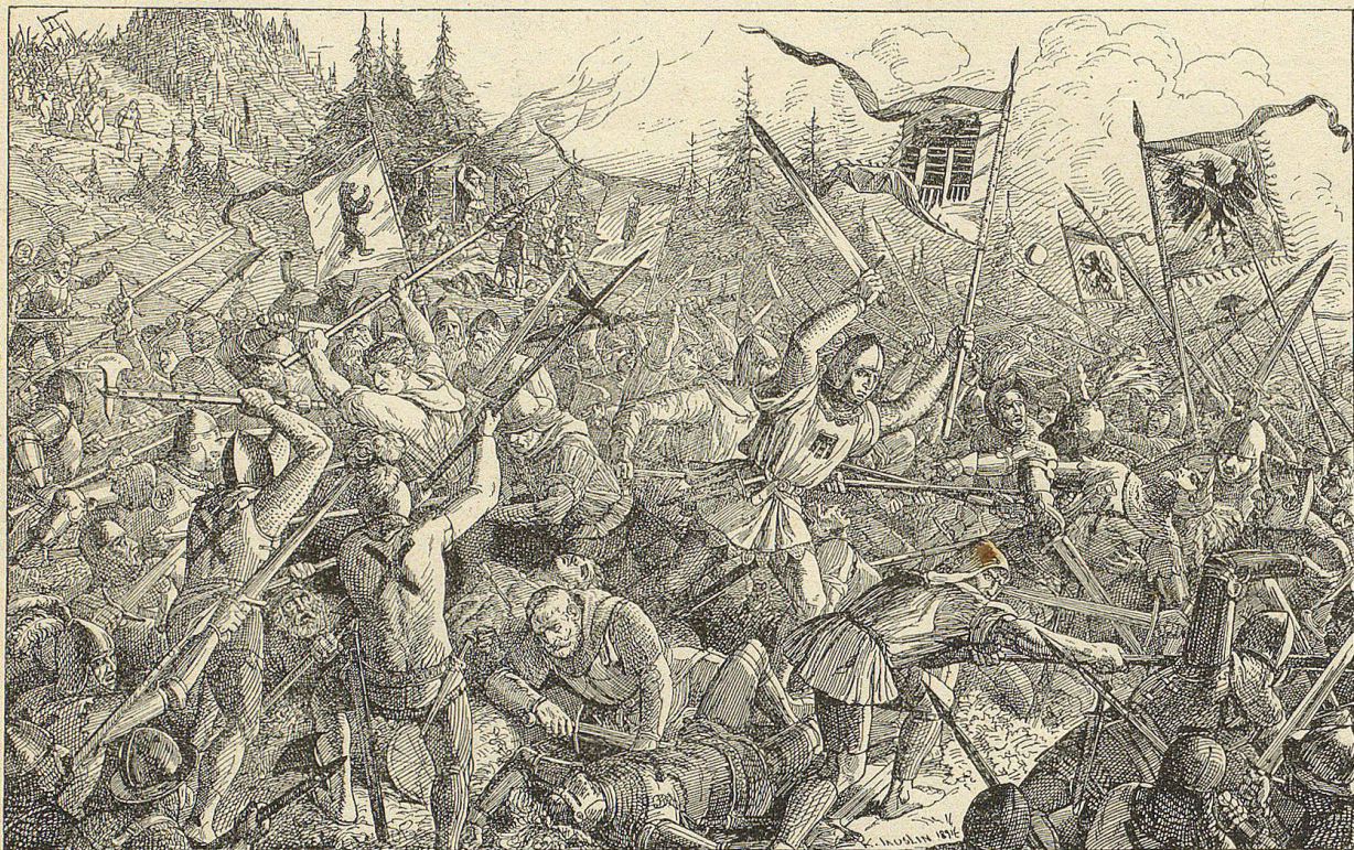
In unaufhaltbarer Wucht stürzten die Frauen mit lautem Geschrei und Gejauchze die Abhänge hinab, dem Schlachtfelde zu.

Mit hochklopfendem Herzen spähte er hinunter, Hohen- und Nieder-Sax zu, über welche der Zug der befreundeten Appenzeller, die ihm die Braut zuführen sollten, herkommen mußte, und der Thürmer fluchte endlich ob seinen ungeduldigen Fragen nach dem Zuge und brummte allerlei unehrbares Zeug in seinen struppen Bart.