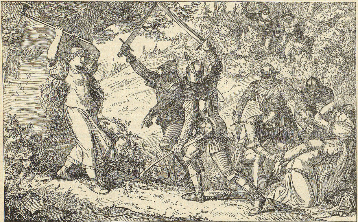
Ein junges, stark gebautes Mädchen in einfacher Appenzeller Tracht wehrte sich mit einem schweren Beilstocke gegen zwei Landsknechte.

Noch einen Blick unsäglicher Wuth, gepaart mit höchster Verachtung, warf Hans über das Bild; dann drang sein Feldgeschrei mit unwiderstehlicher Macht in die Ohren der erschreckten Landsknechte, und ehe