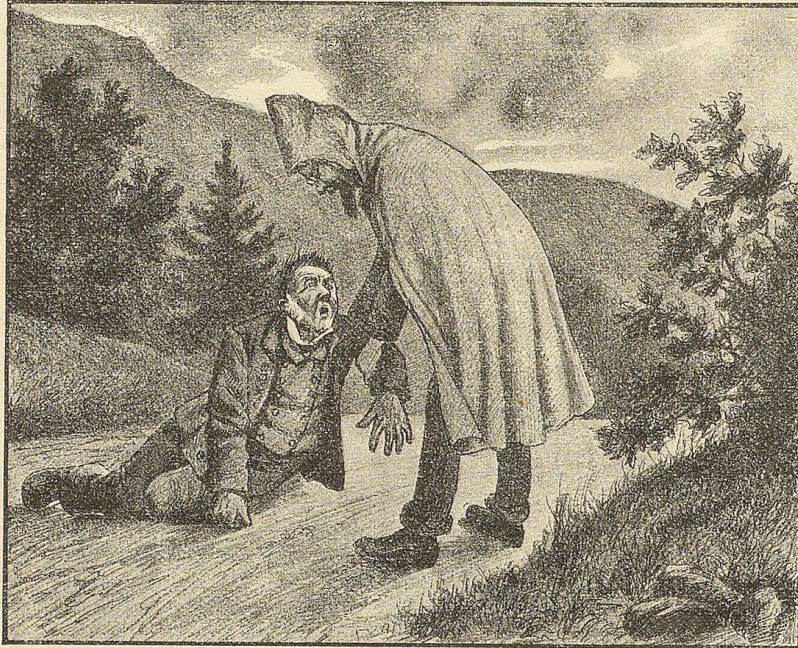
Das Gespenst hat sich über ihn gebeugt. Jetzt packt es ihn am Arm.

Seinen baumlangen, hageren Leib in den schützenden Mantel gehüllt und den treuen „Bakel“, eine Reliquie aus seinen Studentenjahren, unter'm Arm, begab sich der gewissenhafte Arzt unverzüglich auf den Weg, und zwar benützte er, um schnell an's Ziel zu kommen, nicht die Straße, sondern einen Fußweg, der eine große Kurve der letzteren abschnitt.