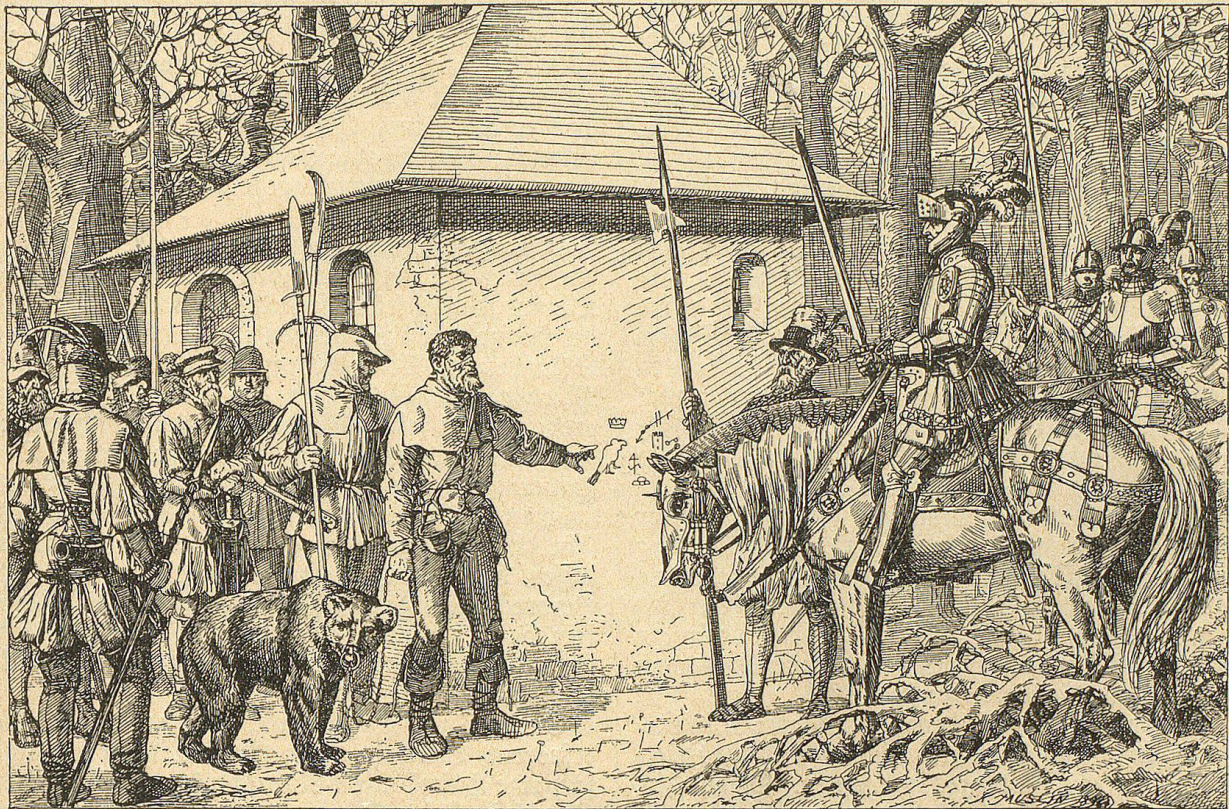
Dann zeigte der Bärenführer auf die einzelnen Zeichen.

Der Fremde trat neben den Truchseß und warf nur einen einzigen Blick auf die rothen Figuren auf dem Mauerwerk. Dann leuchtete es in seinen Augen hell auf von böshafter Freude und er sagte in fremdartig klingendem Dialekt: „Ich will die hundert Gulden verdienen und mir vollständige Straflosigkeit und zudem noch den Dank des hohen Herrn sichern.“