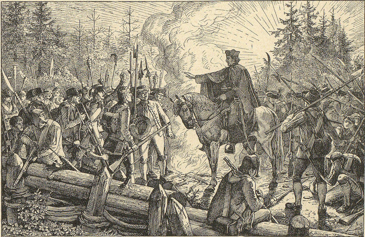
Ich halte für's Beste, wenn ihr nach Hause geht. Das Wehren hilft uns doch nichts.

Zu diesem Zwecke wurde die Landsgemeinde in Schwyz versammelt, aber ein furchtbarer Tumult erhob sich dagegen. Dem Zureden Nedings und vernünftiger Geistlicher gelang es jedoch, ihn zu stillen und beinahe einstimmig wurde die Verfassung angenommen. Die Franzosen hatten über zweitausend, die Schwyzer etwas über zweihundert Mann im Kriege verloren. Jetzt fügten sich auch Glarus, Uri, und zögernd Nidwalden. Sargans bat Schauenburg um Schonung des armen Landes, ebenso Gaster und Uznach. Das Rheinthal folgte und den Schluß