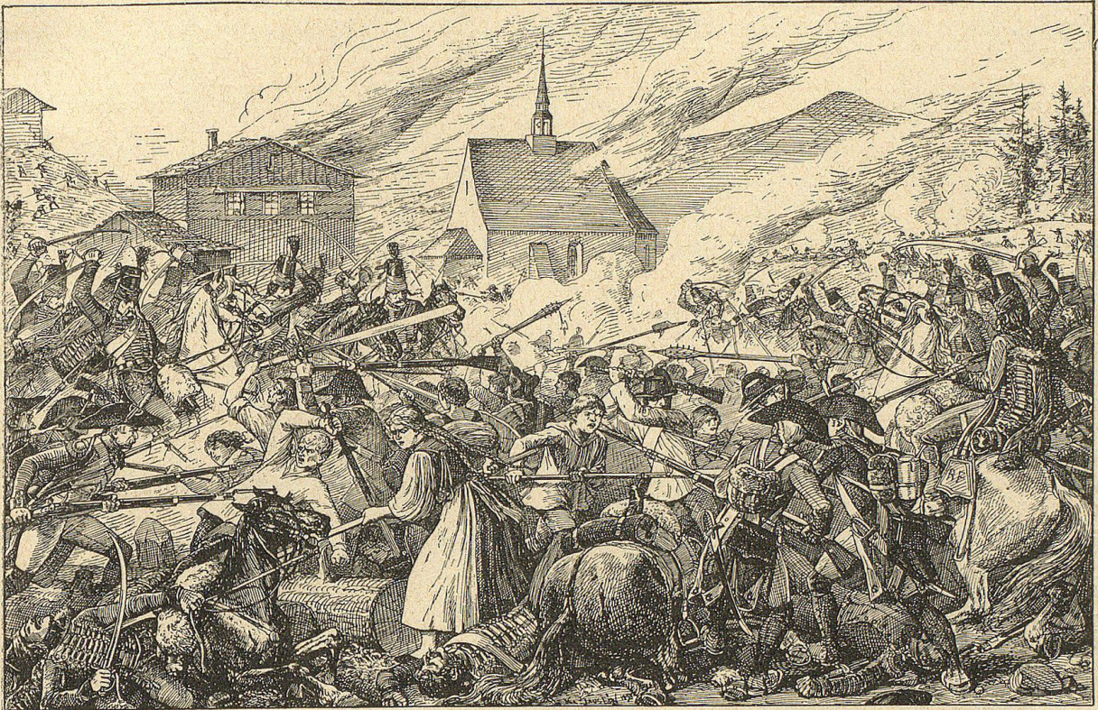
Kampf beim Drachenried.

rückten. Ich werde nun gegen Schwyz marschiren; wenn es Widerstand leistet, werde ich dort ein eben so schreckliches Exempel statuiren. Papiere, die mir in die Hände gefallen, beweisen, daß wenn wir nicht über diese Wahnsinnigen gesiegt hätten, der Aufstand in Kurzem allgemein geworden wäre; Alles hängt aneinander. Aber die Anstifter sind meist umgekommen. Die Bauern selber, deren Augen endlich aufgegangen sind, bringen mir auch die andern herbei. — Ich hoffe, daß dies das letzte Stück Arbeit in diesem Kriege gewesen sei. Alle diese Vorfälle