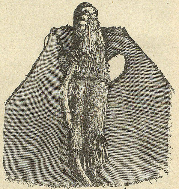
Zwei Alraunwurzeln mit ihren Gewändern aus dem Besitze Kaiser Rudolfs II. (1576—1612).

sorgfältig gepflegt und prächtig gekleidet, Sonnabends in Wasser oder Wein gebadet und sollten dem verschwiegenen Besitzer Reichthum, Gesundheit und andere irdische Güter, Glück bei Prozessen, Fruchtbarkeit den Frauen und Beförderung der Geburten bringen. Die Charlatane des Mittelalters verkauften sie um hohen Preis. Den meisten Werth hatten die unter dem Galgen gefundenen und von einem schwarzen Hund der Erde entrissenen Männchen. Selbstverständlich ist so ein Alraun nur mit Hilfe des Teufels zu erlangen, denn der Alrun selbst ist ein Stück Teufel und der Besitzer muß seine Seele dem Satan verschreiben. Anders ist die Zubereitung in unserer Gegend. Ein junger Laubfrosch wird beim Vollmond gefangen und unter Anrufung des bösen Geistes mit Hilfe eines Zauberers oder Hexenmeisters unter schmutzigen Ceremonien zum Alrun gemacht. Der glückliche Besitzer setzt denselben in ein verschlossenes Gefäß und hier legt das Zaubertier Tag für Tag ein großes Stück Geld. Sowie aber das Auge