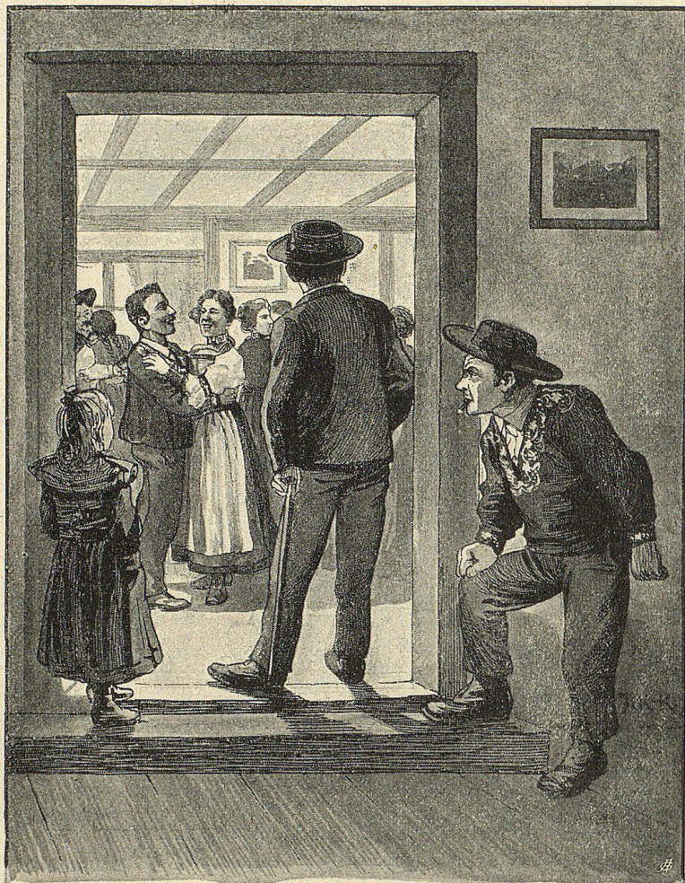
Was trieben sie jetzt da draußen? Es wunderte ihn doch. Dann stand er in die Türschwelle.

„Der Stämpfeler und die Oberschwandenkarline.“ Er hörte es wohl, wie es hinter ihm zischte, als er durch den Gang nach dem Tanzsaal schritt. Seine Augen leuchteten stolz. Die der Karline suchten im Gedränge. „Guten Abend Sepp! Machst denn doch auch einen Tanz mit mir?“ Die Hand, welche eben noch das Schürzenband ordnete, war jetzt frei. Sie sügte sich willig in die schwieligen Finger des Rüttschep.