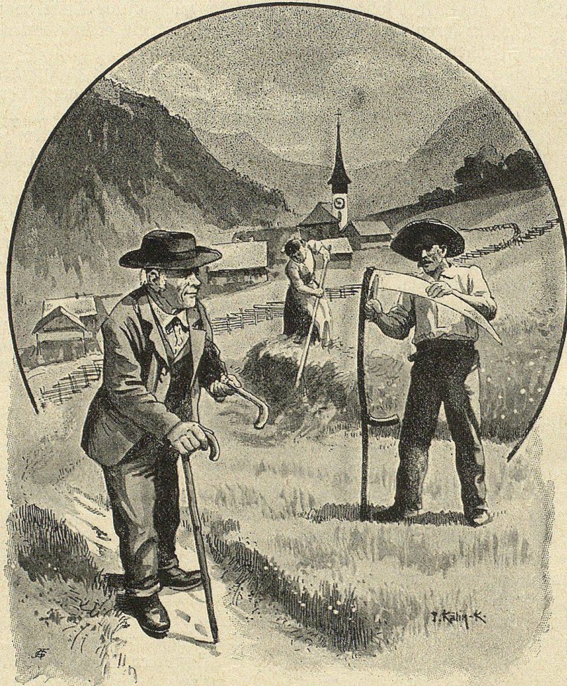
Sein Haar war grau geworden, seine Gestalt gebeugt, die Beine noch kürzer und die Schrittlein noch kleiner als früher.

Immer weiter dehnte sich die Helle aus. Das Knistern des Feuers ward zu einem Knuschen von