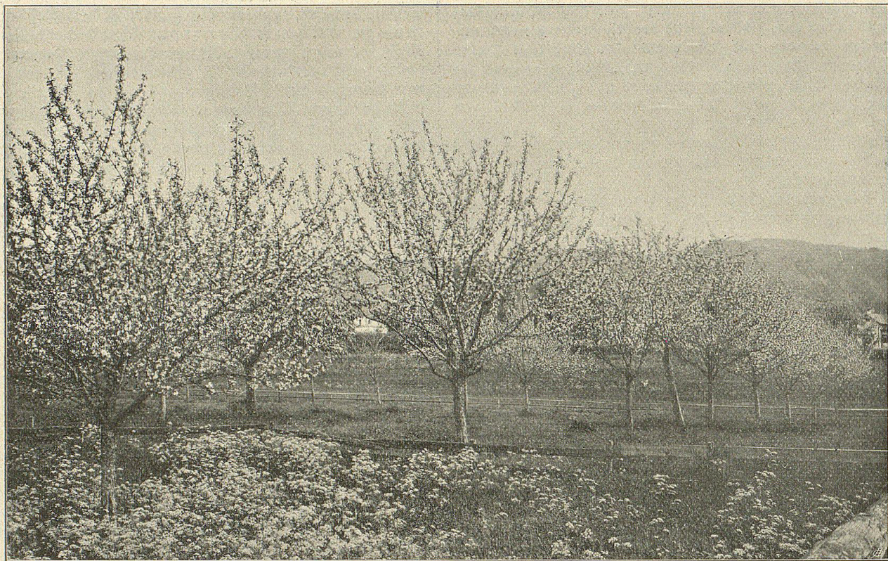
Apfelbäume in voller Blüte.

Verfahren der Baumbeschaffung nicht. Wer die Zeit des Suchens, Ausgrabens, Verpflanzens rechnet, das oft schlechte Wurzelwerk, den krummen Stamm, das häufige Absterben solcher Bäume in Betracht zieht, der kommt zum Schluß, daß sie nicht billig, wohl aber sehr teuer und dazu gering sind. Auch hat man dann im günstigsten Fall erst einen wilden Baum, der noch veredelt werden muß und dieses