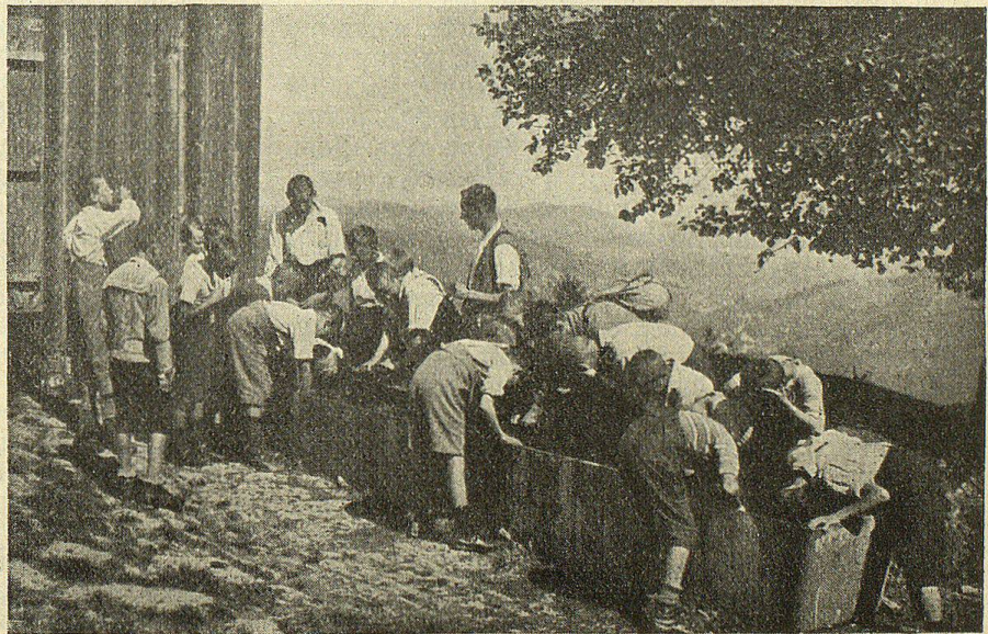
An der Tränke.