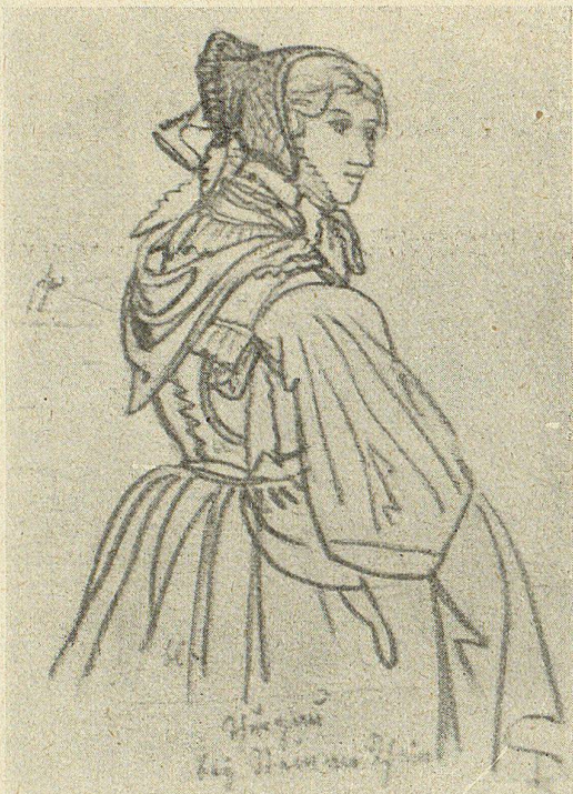
Bild 1. Panzermieder, dicke Hüften.

Der Appenzeller Kalender hat seinen Lesern bereits in früheren Jahrgängen gezeigt, daß die heutigen Kantonsgrenzen in der Schweiz selten auch die Grenzen für bestimmte Trachten bilden. Die Verbreitung und Ausdehnung einer Tracht richtete sich mehr nach politischer, Glaubens- oder Standeszugehörigkeit. So auch im Kanton Thurgau. Der nördliche Kantonsteil längs des Bodensees bis Dießenhofen am Rhein unweit der Stadt Schaffhausen hatte nie eine für sich eigenartige Tracht aufzuweisen. Das Fehlen einer ausgeprägten Tracht ist darauf zurückzuführen, daß besonders in diesem Teil des Thurgaus Industrie, Handel und Verkehr