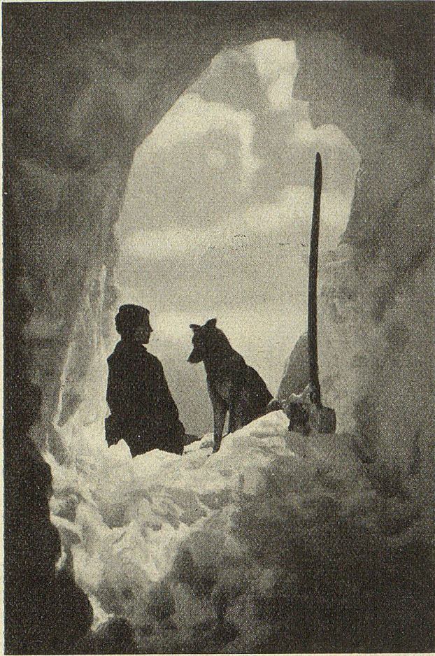
Der Schneestollen vor dem Eßzimmerfenster des Säntis-Observatoriums.

monate zu schildern wußte, die Farbenwunder des Sonnenauf- und Unterganges, die funkelnden Raureisbilder und stillen Sternennächte. Ich sah und spürte: Hier stand ein Mann, dem der Posten und nicht das Geld die Hauptsache war.