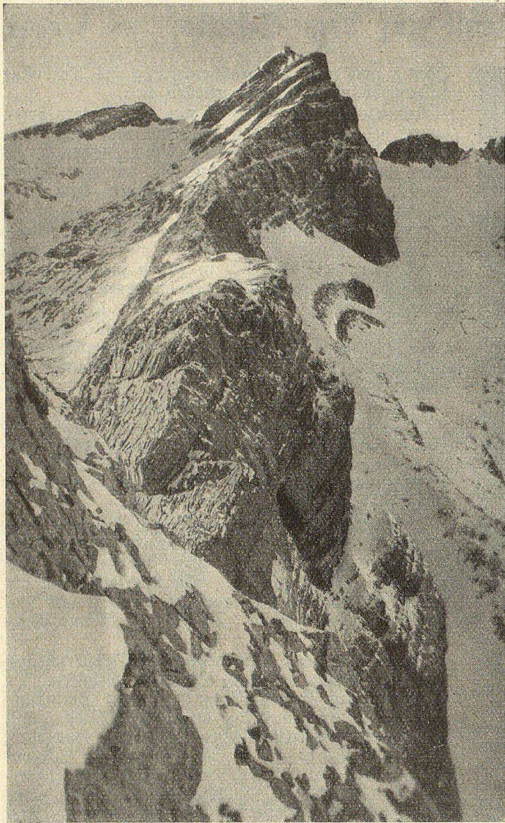
Säntis mit Böösegg-Grat.