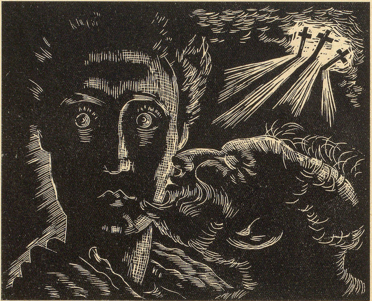
J. Nef. „Judas-Kuß“, Holzschnitt.

die: ob man menschliche Kraft und künstlerische Möglichkeit genug besitzt, um zum guten Ende zu kommen! Auf jeden Fall erfordert das Bildnis maximale Hingabe als Maler und als Mensch. Oft scheint mir die menschliche Aufgabe die größere und zugleich entscheidende zu sein.