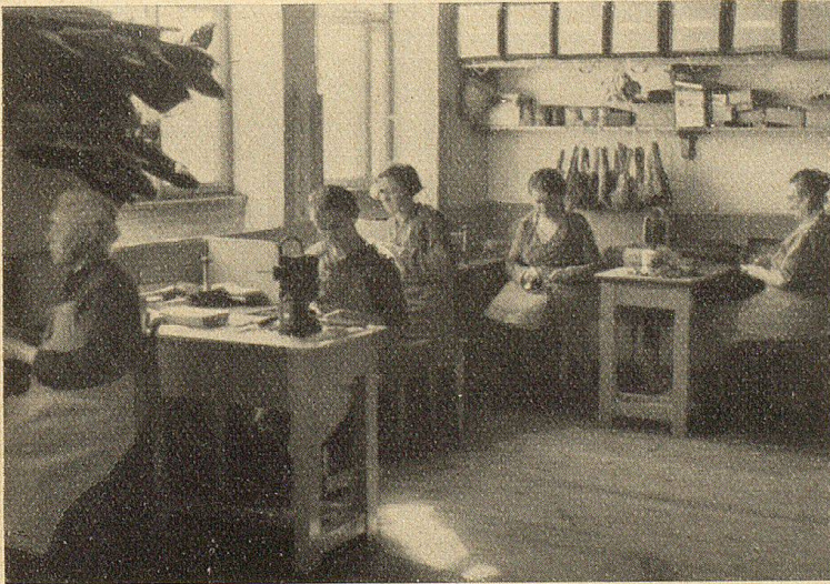
Blinde Frauen erstellen Bürsten.

Einem dritten Zwecke dient das an der Bruggwaldstraße gelegene Blindenasyl, die frühere Wirtschaft zur Fernsicht. Während im Blindenheim und im Blinden-Altersheim meist gesunde Blinde sich aufhalten, hat das Blindenasyl die Aufgabe, fränkliche, schwache Blinde, auch Taubblinde, aber auch schwachsinnige Blinde aufzunehmen, die einer besonderen Pflege bedürfen und die, weil das Asyl kleiner ist als das Blindenheim und Blinden-Alters-