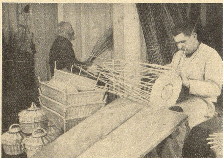
Blinde an der Arbeit.

Schon oft haben wir unsere Blindenfreunde, sie möchten sich durch persönliche Besuche in unseren Blindenanstalten von dem Glück überzeugen, das ihre Gaben bei den Blinden erwirkt haben. Aber viele überfällt eine Scheu, wenn sie sich die rund 140 Blinden in unseren drei Blindenanstalten vorstellen. Sie glauben, vor lauter Mitleid ihren Anblick nicht ertragen zu können. Wie ganz anders denken unsere Besucher, private Interessenten und Schulen, beim Verlassen unserer Anstalten: So viel Fröhlichkeit, Schaffenseifer und Lebensmut haben sie gar nicht bei uns erwartet, und angenehmenttäuscht und befriedigt nimmt sich mancher vor, der Blindensache auch in Zukunft Treue zu bewahren.