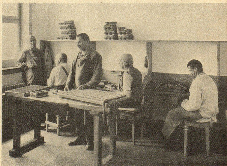
Blinde an der Arbeit.

zainen zu flechten, und — schließlich bei der Gesellenstufe angelangt — den schöngeflochlenen Postkorb und die großen Reiskörbe zu fabrizieren imstande ist. Nicht zum Auslernen kommt der Blinde aber bei den Reparaturarbeiten. In neuester Zeit wurden Versuche gemacht mit Feddigrohrmöbeln, Truhen, die schon gute Resultate zeitigten. Eine ganz andere Beschäftigungsart der Blinden ist das Flechten der Türvorlagen, das Herstellen der Ledermatten und Pneumatten, auch das Weben der sog. Bürstenmatten auf dem Webstuhl. Interessant für den