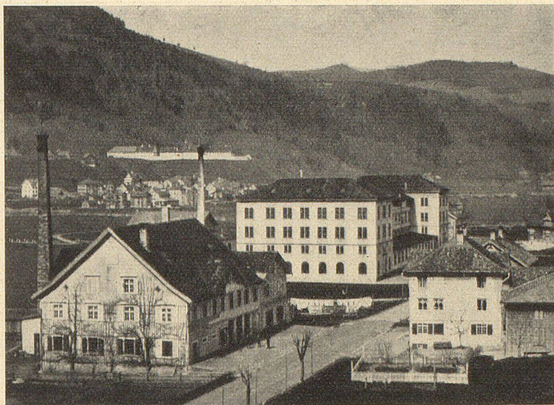
Alte Rietwies mit Blick gegen Ennetbrugg und Klosterli. (Vorn erstes Wohnhaus und Garnfärberei Heberlein; hinten Raschleische Buntweberei, erbaut 1865, 1906 von Heberlein A.-G. übernommen).