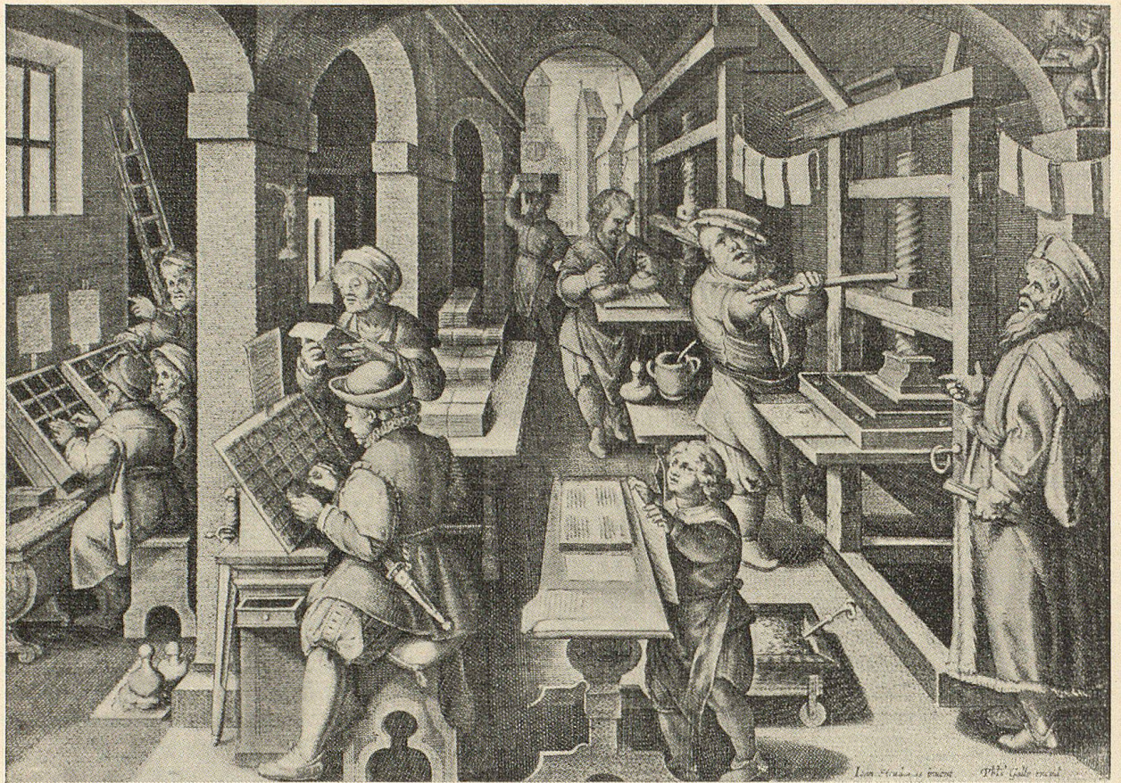
Buchdruckerei im ausgehenden 16. Jahrhundert. (Nach Johs. Stradanus gestochen von Th. Golle.)

spiegelt sie die ganze Mannigfaltigkeit des geistigen Lebens wieder; in totalitären Staaten übt sie als von der Regierung gleichgeschaltete Presse womöglich einen noch größeren Einfluß aus. Man kann mit Jacob Burckhardt die Vermüstung des modernen Geisteslebens durch die Presse beklagen, aber man darf sie jedenfalls keineswegs geringschätzen. Und wenn einerseits die Leiter der großen Weltblätter an Macht und Einfluß einem Minister gleichkommen, so hat andererseits auch die kleine und lokale Presse ihre eigenen Aufgaben und dankbaren Ziele. Im Jahre 1840 fand in St. Gallen eine öffent-