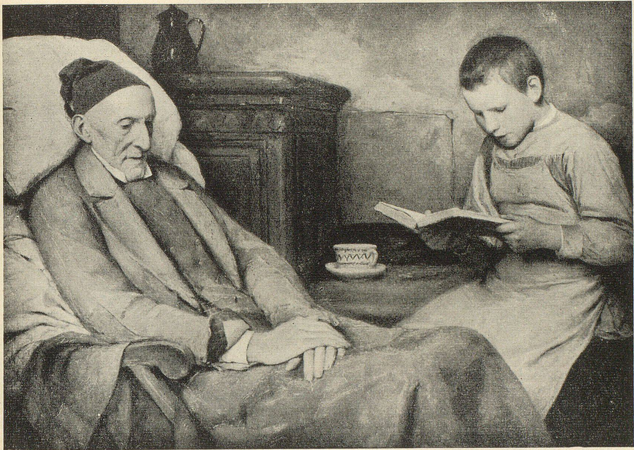
„Großvaters Andachtsstunde“ von Albert Anker, Ins 1893 (Albert Anker, dessen 30. Todestag am 16. Juli 1940 dessen Werke der Allgemeinheit freigeibt, ist für die bildnerische Kunst von ähnlicher Bedeutung wie sein älterer Landsmann, Jeremias Gotthelf, beide waren die berufensten Schilderer des Bauernlebens in Wort und Bild).

übrigen Parteien nicht weniger als elf Wahlkandidaten auf die Liste genommen, unter ihnen auch den Eusebius, der an seiner Wahl nicht im geringsten zweifelte. Die Bernerin im „Roten Ochsen“ bestärkte ihn mächtig in seiner Annahme, und Eusebius plante in seinem Innern, sie dann sicher heimzuführen, wenn er einmal als Kantonsrat im Dorfe herumstolzieren konnte.