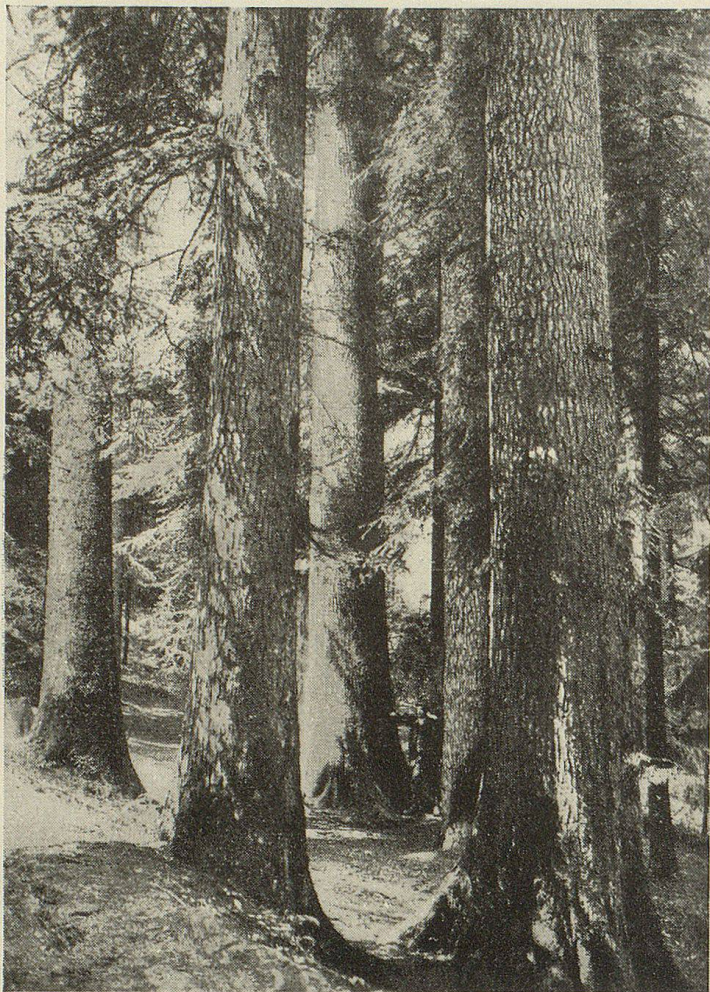
Im Dürsrütivald bei Langnau i. E. (Phot. Eidg. forstl. Versuchsanstalt, Zürich).

in der Forstwirtschaft war man zurückhaltend; diese Bauern glaubten noch lange nicht, daß etwas gut sei, nur weil es neu ist und gerühmt wird. Solche Vorsicht wäre ja mancherorts am Platz; am besten bewährt sie sich im Forstwesen, wo einmal begangene Fehler sich beim langen Leben der Bäume auf Jahrhunderte hinaus rächen können. Wohl fünf Jahrzehnte lang, etwa von 1860-1910, war es vom Ausland her eingeschleppter Brauch, weite Waldungen kahl zu schlagen und dann auf den öden Flächen meistens Kottannen (Fichten) künstlich anzupflanzen oder zu pflanzen. Erst allmählich, oft zu spät, wurde erkannt, daß die so entblößten Böden verwilderten und verarmten und daß diese künstlichen, reinen und gleichalterigen Wälder von Pilzen und Insekten heimgesucht wurden. So kam man nach teuren Lehrjahren wieder zum Plenterbetrieb zurück, der gemischte, ungleichalterige Wälder erziehen will, die sich natürlich unter dem Schutz der Mutterbäume verjüngen.