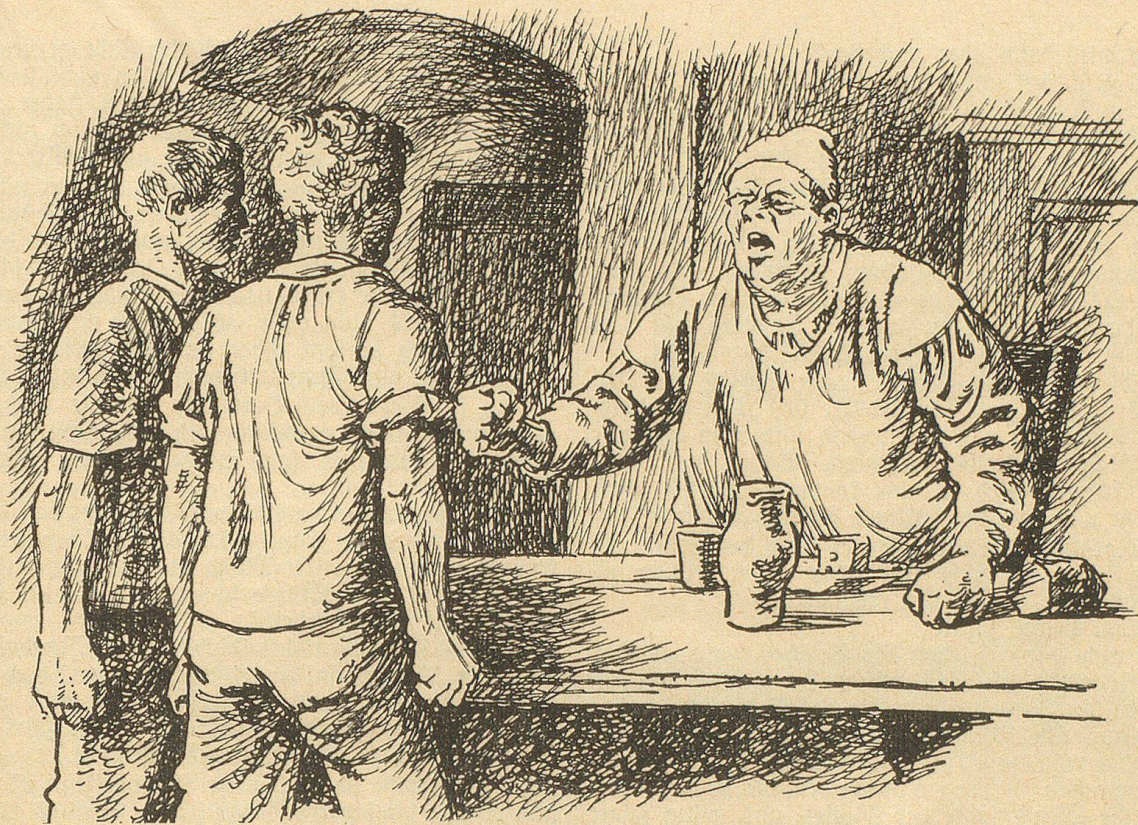
Da schlug der Müller die geballte Faust auf den Tisch

„Sieh dich vor, Bauer! Wenn du den Müller bis Jakobi nicht befriedigst, laß ich dich pfänden!“ rief der Vogt Franzsepp nach, doch ein Hohnlachen war dessen Antwort, und grimmig machten sich die beiden Freunde auf den Heimweg.