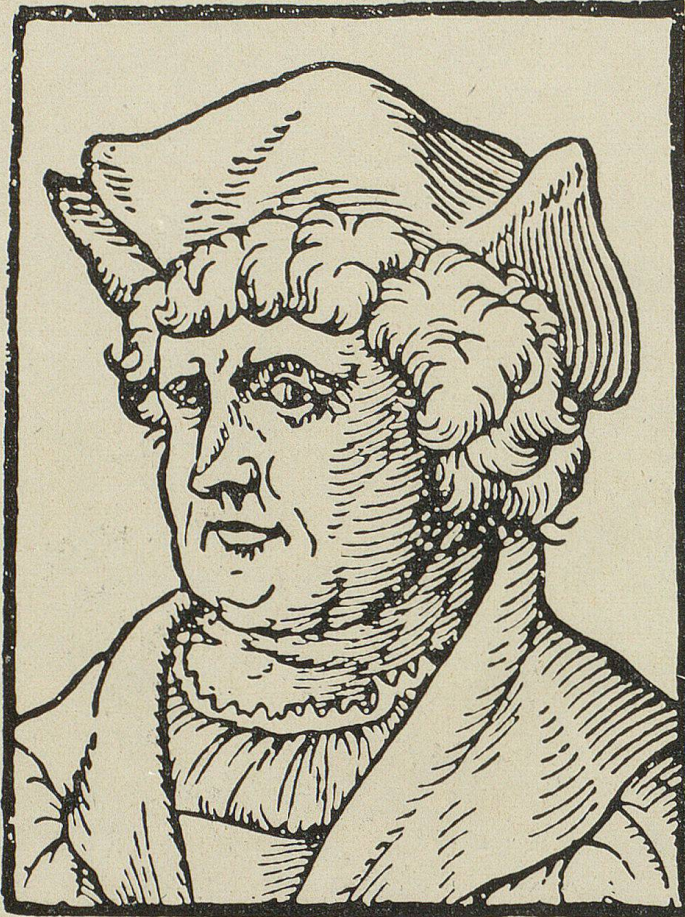
Heinrich Loriti genannt Glarean

der zum bedeutendsten Humanisten der Schweiz heranwuchs, nämlich Heinrich Loriti von Mollis (1488–1563). Er nannte sich nach seinem Heimattal, oder, wie er später erklärte, nach seiner elterlichen Heimstätte, dem Steinacker, wo sein Geburtshaus noch steht, Glareanus. Er war sowohl eine eigenwillige als auch ausgeprägte urwüchsige Persönlichkeit von umfassendem Wissen, der während eines halben Jahrhunderts als Lehrer eine unermüdliche erfolgreiche Tätigkeit entfaltete. Daneben zeichnete er sich als Dichter von Rang, als Philolog, als Geograph und Kartograph, als Mathematiker und Musiker aus. Die Frucht seiner schriftstellerischen Lebensarbeit besteht aus 30 zu seinen Lebzeiten gedruckten Werken; andere sind erst in unserer Zeit ans Tageslicht gefördert worden, weitere harren noch der Bearbeitung und Veröffentlichung.