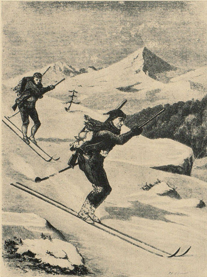
Jäger auf Skiern (Um 1870)

lange Zeit bedenklich schlecht. Das Skifahren beschränkte sich aufs Bergaufsteigen und auf möglichst sturzfreie Schussfahrten. Von Schwüngen wußten unsere Skipioniere so viel wie nichts. Rechtzeitiges Bremsen und Anhalten war deshalb keine einfache Sache. Dem Skistock – man hatte gewöhnlich nur einen – kam unter diesen Umständen größte Bedeutung zu. Er war zwei bis zweieinhalb Meter lang, bestand aus Bambus, und wies unten eine Stahlscheibe auf. Indem man ihn bei der Abfahrt zwischen die Beine klemmte, konnte man das