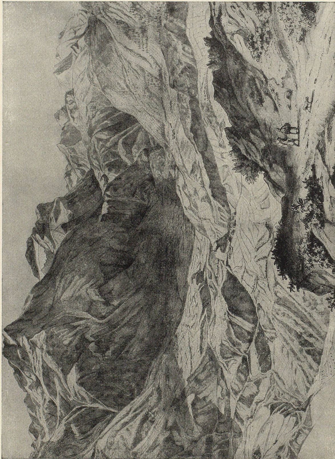
Panorama von Schams

Von links nach rechts: Piz de la Tschera, Piz Grisch, Madriserhörner, Piz Miez, Piz Timun, Suretta-Gruppe.