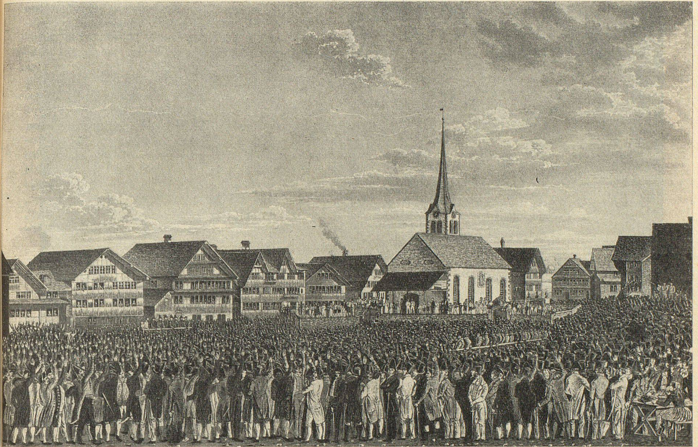
Außerordentliche Landsgemeinde in Hundwil vom 3. März 1833