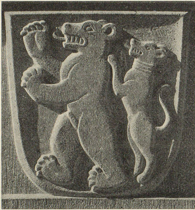
Gemeindewappen von Hundwil Detail vom Landsgemeindebrunnen

In den Grenzstreitigkeiten zwischen den Gottesleuten von Hundwil und Appenzell (Abbatiscella) vermittelte 1323 der Abt von St. Gallen, indem er ihnen als Markt ungefähr diejenige Grenzlinie festsetzte, welche heute noch zwischen Außer-Rhoden und Inner-Rhoden besteht. Um die gleiche Zeit wird Hundwil neben Appenzell, Urnäsch (Urnäschen) und Teufen (Tufin) als Amt bezeichnet, und von einem Amtmann verwaltet.