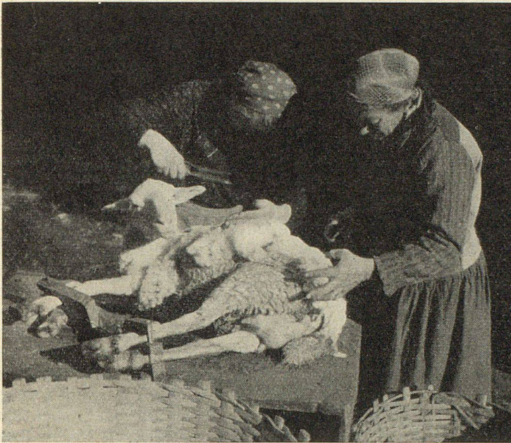
Das Scheren des Schafes

Die abgeschnittene Wolle wird in die Gerla (vorn) gelegt