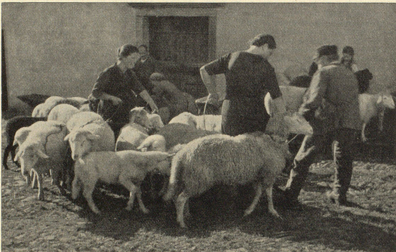
Heimkehr der Tiere von der Alp

Auf dem Dorfplatz werden sie von ihren Besitzern in Empfang genommen (Schafscheid)