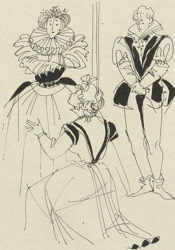
«Mutter — Frau Mutter! Laßt mich hier!» flehte Agnes bittend und hob ihre Augen zu der stolzen Frau auf.

Verena lebte seit einigen Wochen bei einer Muhme zu Stein am Rhein. Junker Rudolf verzehrte sich in Sehnsucht nach ihr, denn die Angst kroch in ihm hoch, daß sie einen andern erhören könnte.