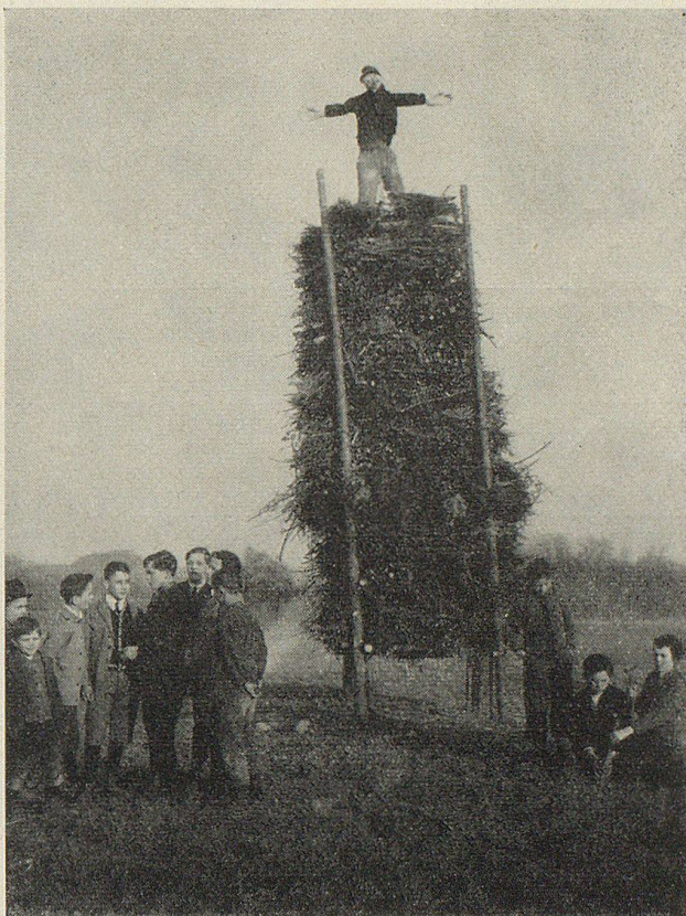
Bögg vor dem Abbrennen

Lichterbräuche heben sich natur- und wesensgemäß ab von dunklem Hintergrund. In ihren