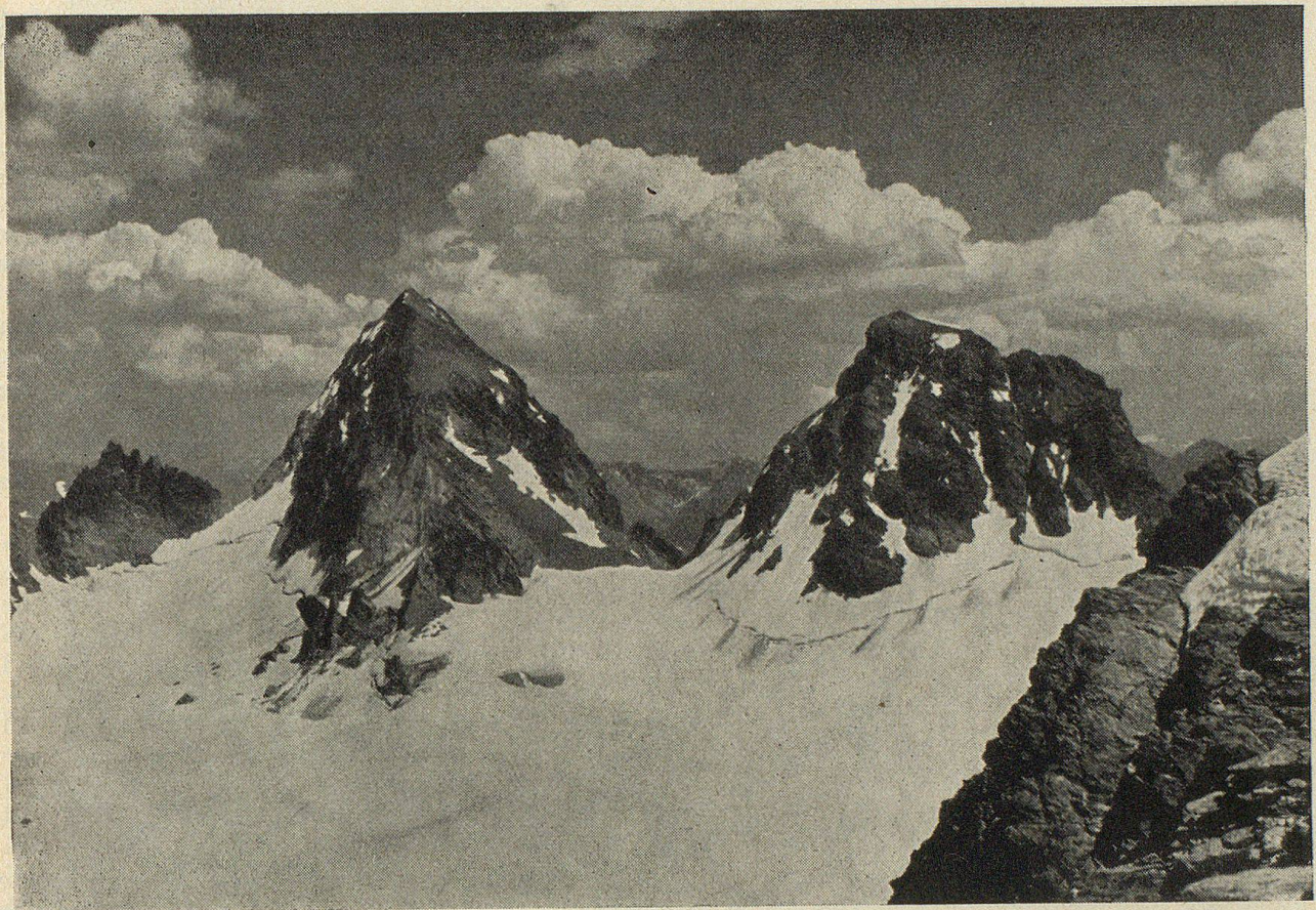
Großer und kleiner Buin (Silvrettagebiet)