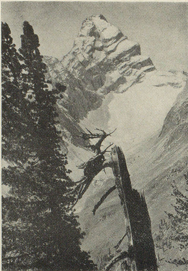
Tinzenhorn, 3179 m ü. M.

hat er sich über seine Überquerung der Bündner Alpen nur in dem lapidaren Satz des mineralogisch interessierten Reisenden geäußert: «Ich kenne das Gestein der Bündner Berge.»