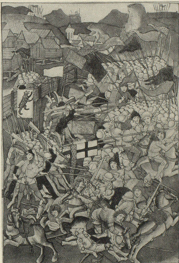
Die Schlacht bei Vögelinsegg, 1403 (Aus Diebold Schillings priv. Bernerchronik)

Vorher hatten sich die Bergleute am Alpstein mit der Rolle eines zugewandten Ortes begnügen müssen. Mehr als 100 Jahre lang. Das Landrecht mit Schwyz 1403, die wertvolle Hilfe im Kampf um die Freiheit gegen die Restaurationspolitik Abt Kunos von St. Gallen, bedeutete den Anfang der politischen Bindungen an die eidgenössischen Orte. Appenzell wurde damals, was wir mit heutigen Begriffen einen schwyzerischen Satellitenstaat nennen würden. Schwyzer führten das Landessiegel und den Hauptmannsstab. Unter schwyzerischer Leitung entstand eine ostschweizerisch-vorarlbergische Eidgenossenschaft aus Bauernschaften und Städten im Bund ob dem See. Der Zusammenbruch dieses rasch gezimmerten Staatswesens führte zu einem Zerwürfnis mit Schwyz. Die Appenzeller wollten nicht mehr alles auf eine Karte setzen und suchten Anschluß auch an die mit Schwyz rivalisierenden Orte. Am 24. Nov. schlossen die VII östlichen Orte der Eidgenossenschaft — Bern machte nicht mit — ein Burg- und Landrecht mit Appenzell, das der Bauernrepublik am Alpstein die Stellung eines eidgenössischen Protektorates einräumte. Die eidg. Orte