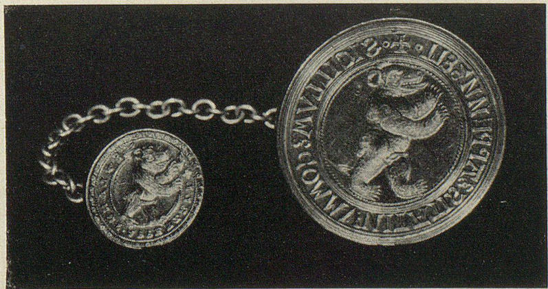
Großes und kleines Landessiegel von Appenzell 1518/1530 (Im Landesarchiv Appenzell)

Die Appenzeller, die bei diesem Feldzug 600 Mann gestellt hatten, erhofften auch einen Anteil an der Beute und meldeten am 20. September 1512 wieder ihren Anspruch um Aufnahme in den Bund. Sie hatten aber nicht mit einer Stimmung bei den Regierungen der VIII Alten Orte gerechnet, die seit 1511 nicht nur den Zugewandten, sondern selbst den drei neuen Orten Freiburg, Solothurn und Schaffhausen das Recht, an den Tagsatzungen teilzunehmen, nur in Kriegsläufen gestatten wollten. Das Hochgefühl