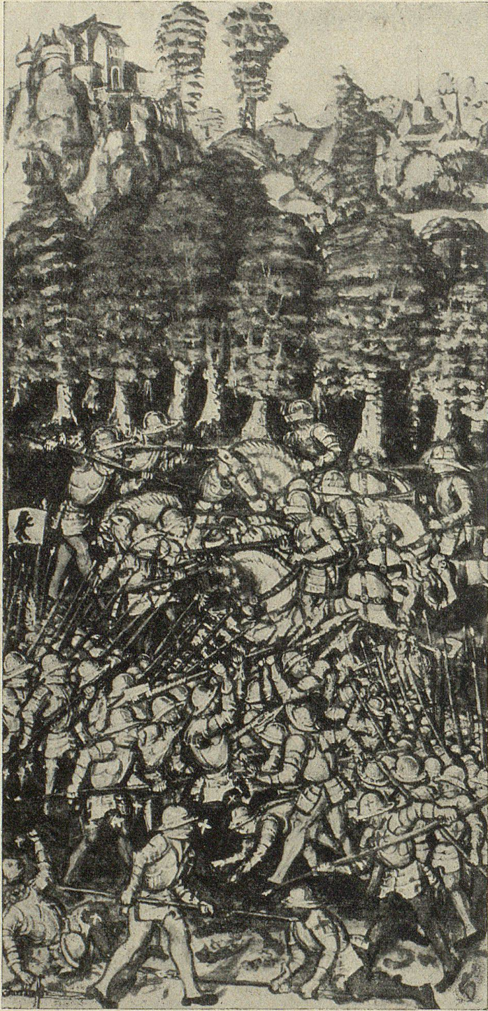
Die Schlacht am Stoß, 1405 (Aus Diebold Schillings Luzernerchronik)

lange auf sich warten. Der Streit zwischen Zürich und Schwyz um das Toggenburger Erbe erweiterte sich zum Alten Zürichkrieg. Das mit