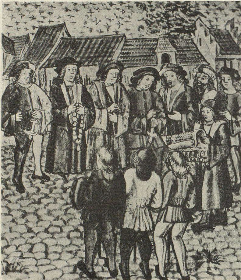
Die Appenzeller beschwören das Landrecht mit den VII Orten von 1411 Darstellung aus der Chronik des Luzerner Schilling:

Ein Schreiber liest den Bundesbrief vor. Die drei Appenzeller (vorn) haben ihre Kopfbedeckung abgenommen. Vor der halbstädtischen Häuserreihe stehen die 7 Gesandten der Eidgenossen in den Standesfarben