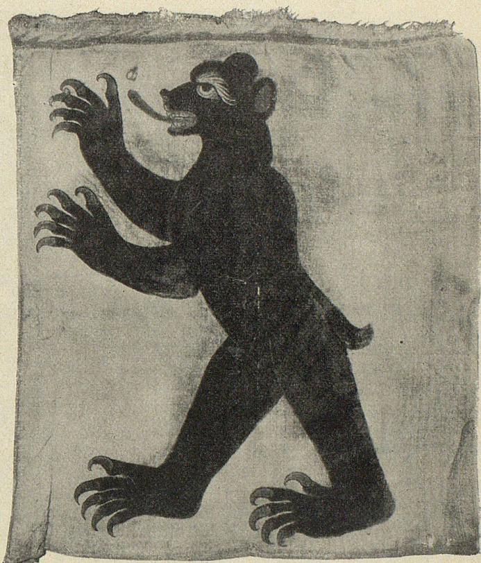
Panner von Appenzell (bemalte Leinwand, I. Hälfte 15. Jh.)

die Mitverantwortung in der Außenpolitik und gemeinsamen Verwaltung zu erobernder Gebiete zu tragen.