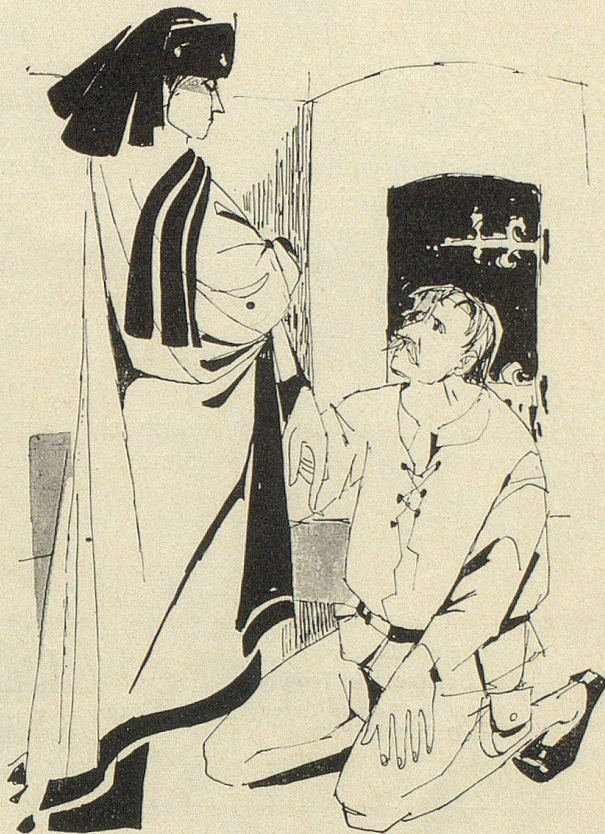
Der rauhe Gerber fiel vor dem Schultheißen auf die Knie und küßte weinend dessen Hand.