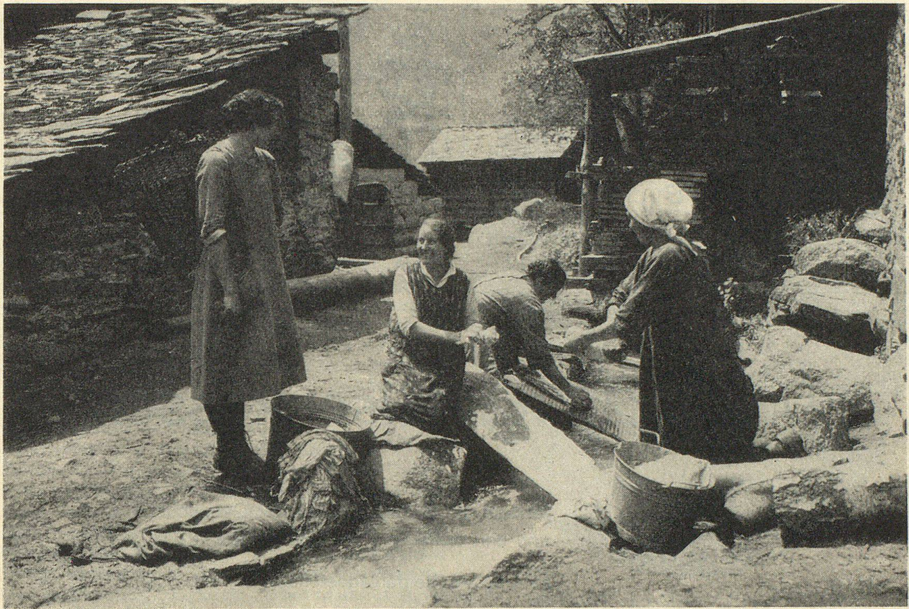
Dorfidyll im Walliser Bergdorf Außerberg. Washtag am Gletscherbach.