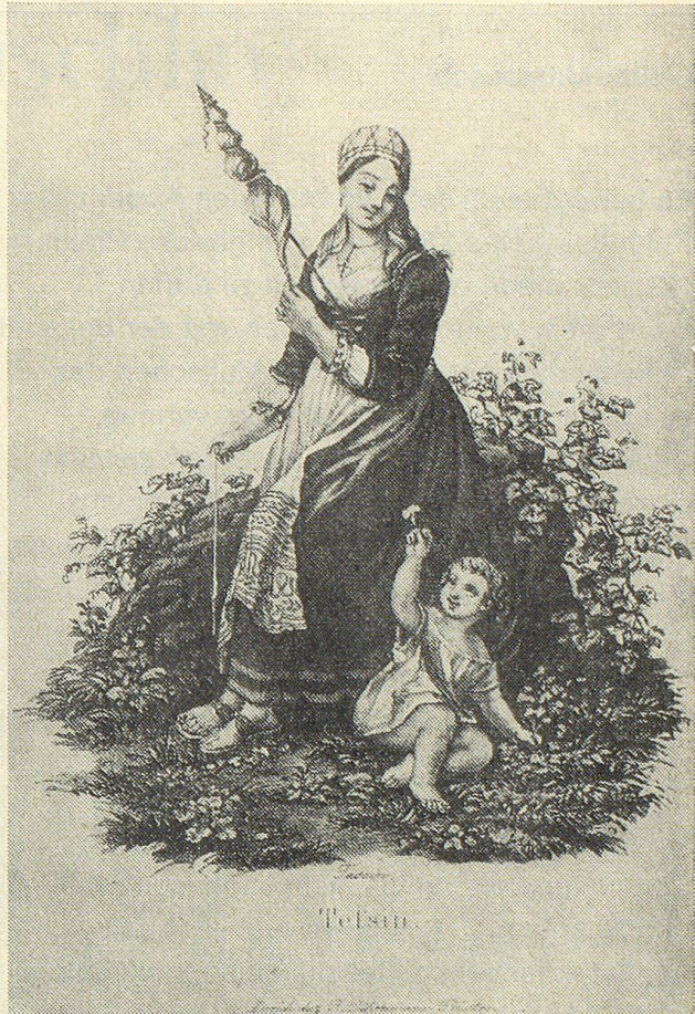
Tessiner Spinnerin aus der guten alten Zeit

«Und Bertha, die die Spindel auch geführt, Sogar zu Pferd, verschwindet in der Ferne, Erreicht bald ihr Königsschloss Payerne.»