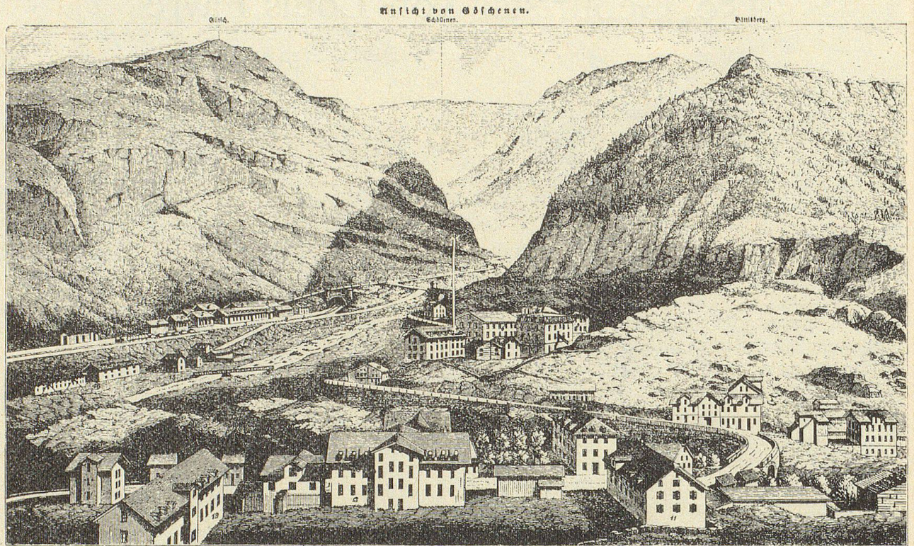
Xyl. Anstalt v. Buri & Jeker, Bern. 1. Bureau von Herrn Bore. 2. Altes Comptoirgebäude. 3. Reparaturwerkstätte. 4. Neues Comptoirgebäude. 5. Schuppen für Tunnelmaschinen. 6. Bureau der Gotthardbahnverwaltung. 7. Dependence zum „Hotel Göschenen“. 8. „Hotel Göschenen“. 9. Postbureau. 10. Altes Postbureau. 11. Gehöf zum „Nöbli“. 12. Aepfhaus. 13. Ehemaliger Episk. 14. Arbeiterwohnungen. 15. Cantinen. Gez. v. J. A. Honegger, Zeichenscheiter, Trucen.

Favre, der den Beruf eines Zimmermanns erlernt hatte und dann zum Eisenbahnbau übergegangen war, bewarb sich, und die Gotthardbahngesellschaft wählte von den sieben eingegangenen Projekten dasjenige Favres. Am 12. September 1872 begann der Durchstich, und am 29. Februar 1880, also nach sieben und einhalb Jahren, erfolgte der Durchbruch des 14 900 Meter langen Tunnels. Louis Favre erlebte den glorreichen Augenblick nicht mehr; er starb am 19. Juli 1879 im Stollen Göschenen an einem Herzschlag.