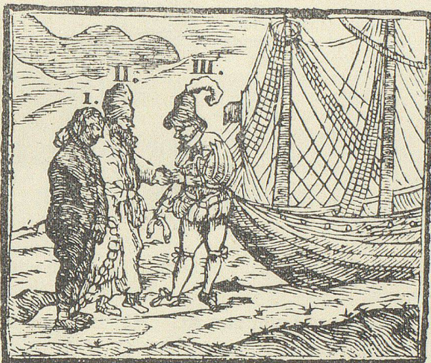
I. Vorstellung eines Sklaven, so verkauft werden soll. II. Der Verkäufer. III. Der Käufer.

Neben den gekrönten Häuptern, den königlichen und anderen Prinzen, den neun Churfürsten, «den Bischöffen in der Eydgnosschafft und den gefürsteten Aebten in der Eydgnosschafft» sind die «Wappen der XIII Hauptorten, zu gleich wenn jeder Ort in den Eydgnössischen-Bund getreten, mit bey gefügter Verzeichnuss deren Herren Ehren Häupter, auch was jedes Orts Läufer und Botten für Farben führen», aufgeführt. Dieser Aufzeich-