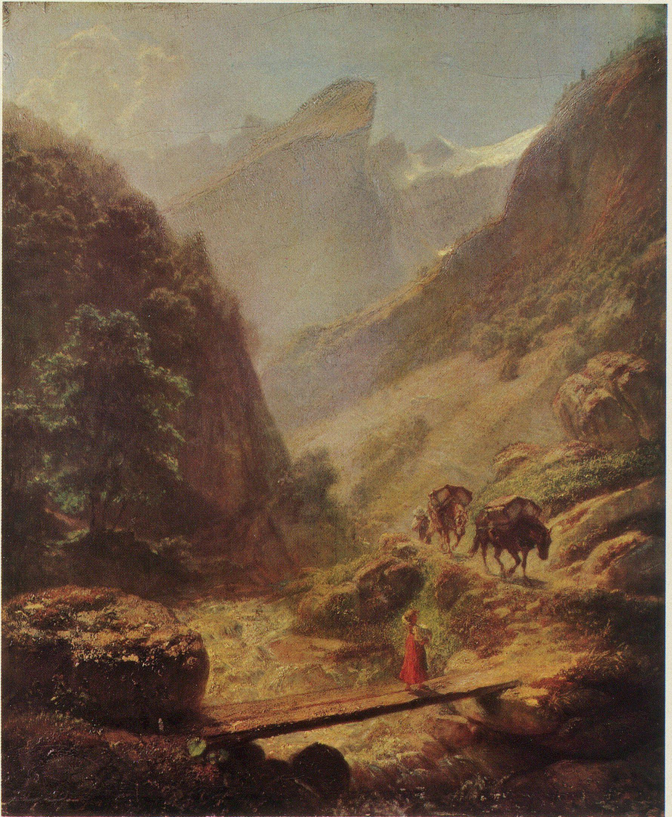
Der Weg zum Seealpsee. Um 1856. Öl auf Leinwand. 66,5 × 55 cm