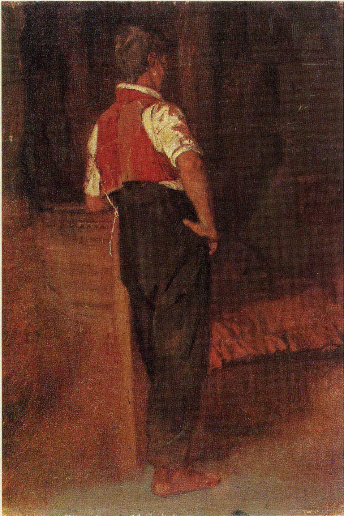
Junger Innerrhoder am Ruhebett. Um 1860. Öl auf Karton. 30,3 × 21,5 cm