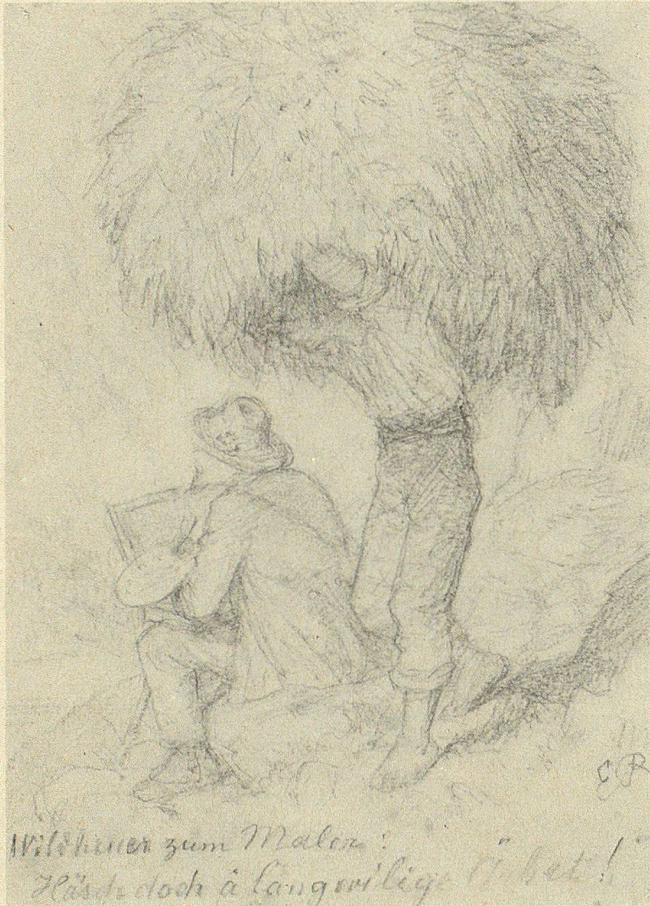
Wildheuer und Maler. Bleistift. 19,6 × 14 cm