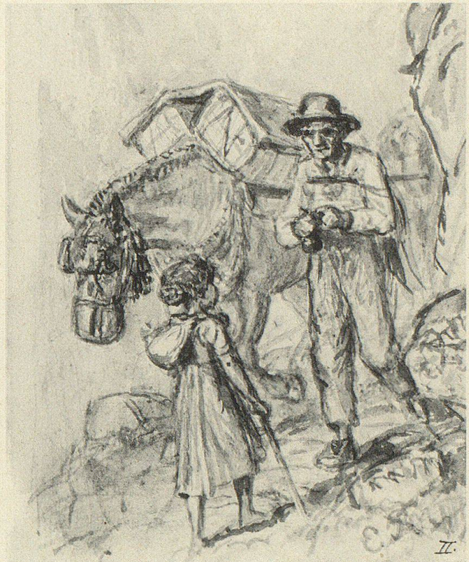
Grempler mit Pferd begegnet einem Mädchen. Pinselzeichnung. Sepia. 12,1 × 10,3 cm