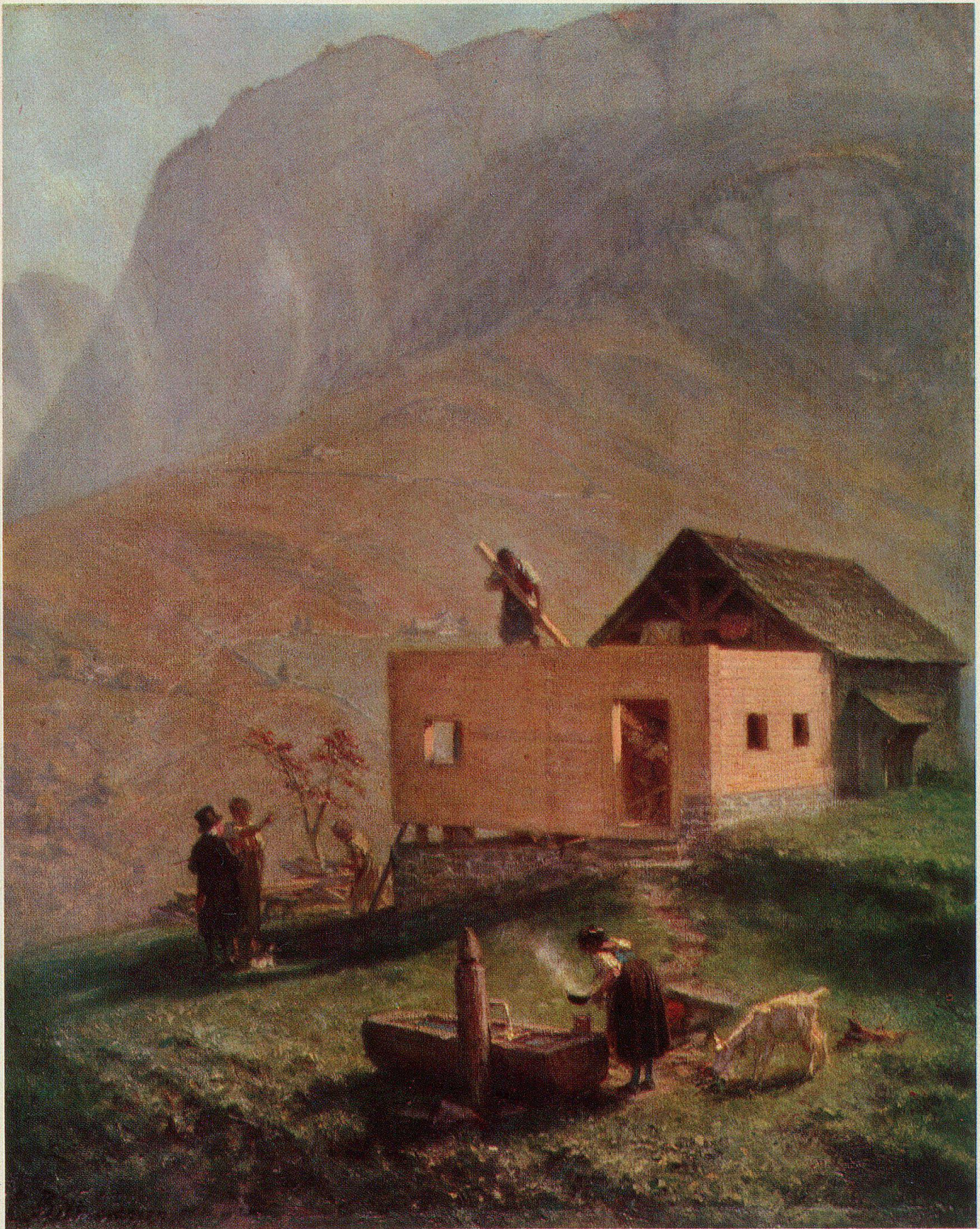
Hausbau im Schwendital. 1861. Öl auf Leinwand. 44,5 × 36 cm