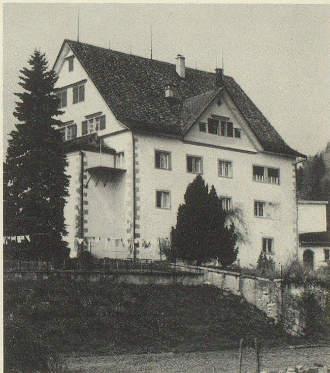
Das prächtige Bürgerhaus zum «Steinfels», erbaut im Jahre 1667

Wer von den umliegenden Höhen aus die Ortschaft überschaut, die sich im Laufe der Zeit vom einstigen Bauerndorf zum Industriedorf entwickelt hat, entdeckt gar bald zwei schlossartig hervorstechende Gebäude, deren Erstellung mehr als drei Jahrhunderte zurückliegt. So einmal der «Steinfels», der im Jahre 1975 einer gründlichen Aussenrenovation unterzogen wurde. Seine Ausmasse sind mit 19 m × 16 m respektabel; die weitläufigen Gewölbekonstruktionen und die Mauerstärken von 1,50 bis 1,80 m in den unteren Stockwerken zeugen von der Stabilität der einstigen Bauweise. Den Grundstein zum «Steinfels» legte der begüterte, schon mit 27 Jahren Ammann vom Thurtal und 1655 Pannerherr gewordene Hans Heinrich Bösch, der aber 1663 verstarb und so die Vollendung seines geplanten Bauvorhabens durch seine drei Söhne im Jahre 1667 nicht mehr erlebte. Rund 100 Jahre später, zur Gründungszeit der evangelischen Kirchgemeinde Ebnat, befand sich das stattliche Bürgerhaus, damals «z. Gmür» genannt, im Eigentum des Kriegsrates und Hauptmannes Dominik Bühler, des Initianten des Kirchenbaues auf dem «Ebnet», und wechselte darnach verschiedentlich den Besitzer. Im umbenannten «Steinfels» wurde