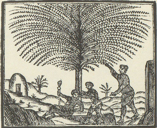
Vorstellung eines Caffeebaums.

In dem Darmstädtischen im Deutschland wurde ein Verbott wider den Caffee-Trank bekannt gemacht. Weil dieser Trank, heisst es in der Verordnung, nur zur Lüsterheit der Zunge, und nicht zum Unterhalt dient, oft der Gesundheit Nachtheil bringt, auch durch denselben und den dabey verschwendeten Zucker grosse Summen Geldes aus dem Lande gezogen werden, und die natürlichen Landes-Getränke, zum merklichen Schaden derer, die sich mit Brau- und Kelterung derselben nähren, in Verachtung, und die Herrschaftlichen Einkünften dadurch in Abnahm gerathen; überdieß vieles Holz durch die Bereitung dieses fremden Getränkes unnöthig verbraucht und viele Zeit damit versäümet wird: so soll der Gebrauch desselben geringen Personen bey 10. Thaler Straffe, und 14tägiger Gefängniß, ganz verboten; Vornehmen aber nur mit einer Abgabe von 8. Kreuzer fürs Pfund, wenn sie ihn mäßig gebrauchen, gestattet seyn.»