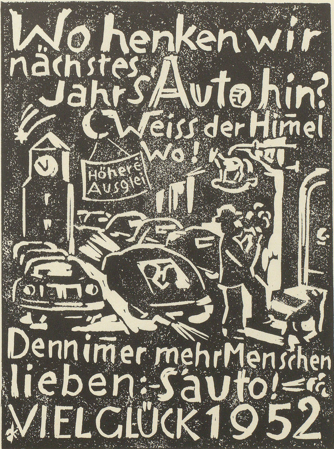
Neujahrskarte 1952, Originallinolschnitt (15/20)