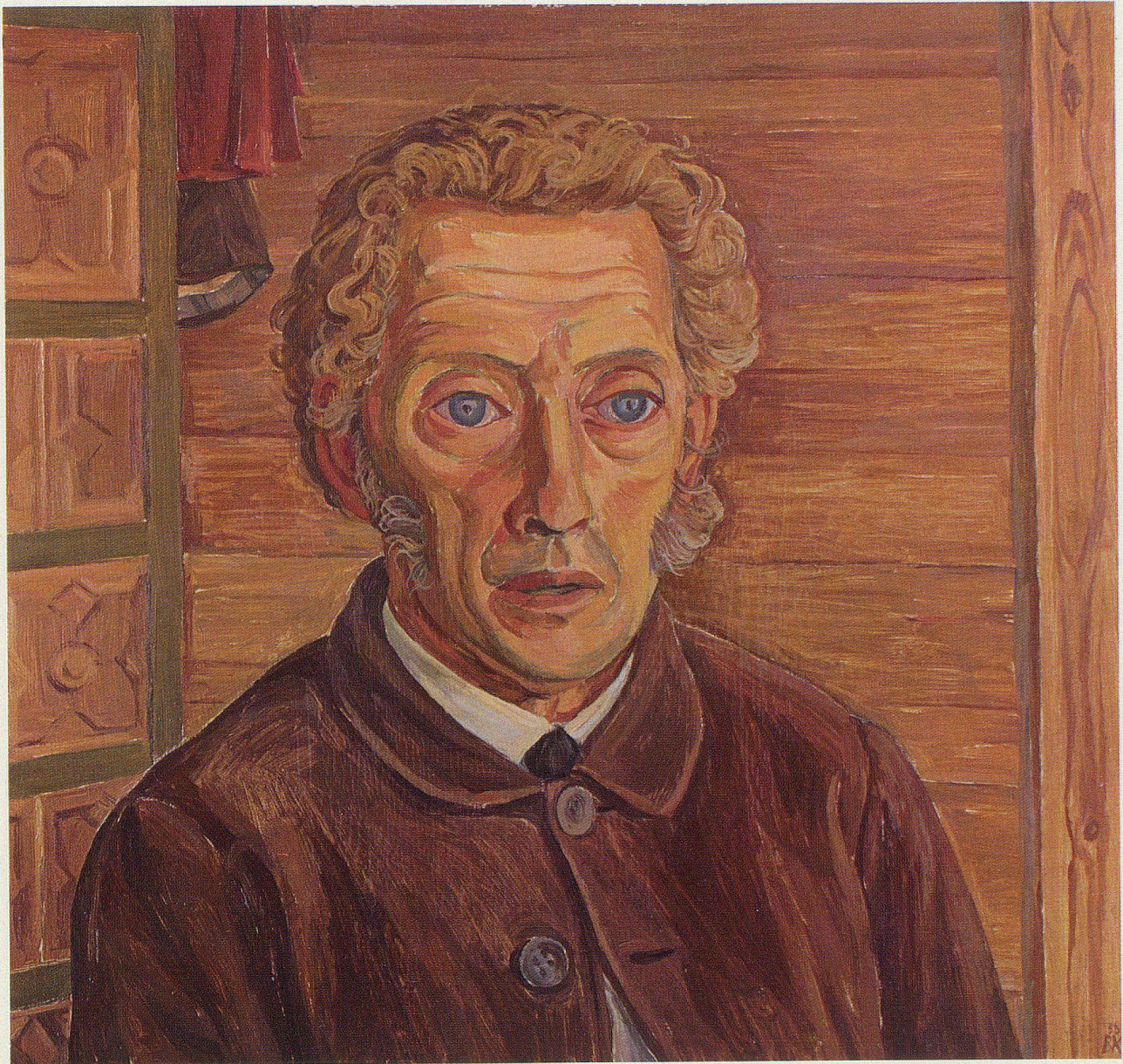
Der arme Bruderer vom ‚Nördli‘ 1938/Oel (48x45)