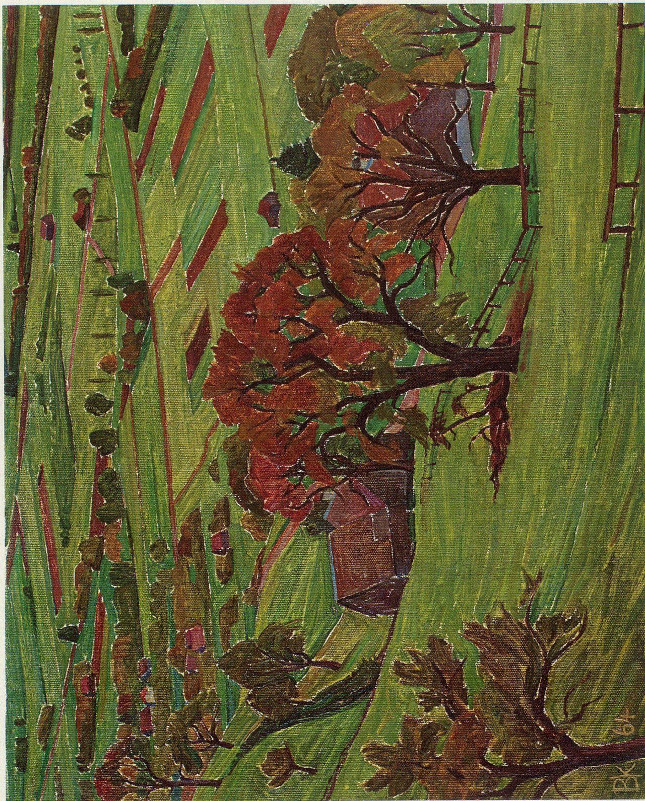
Herbst am Altstätterberg 1964/Oel (40x32)