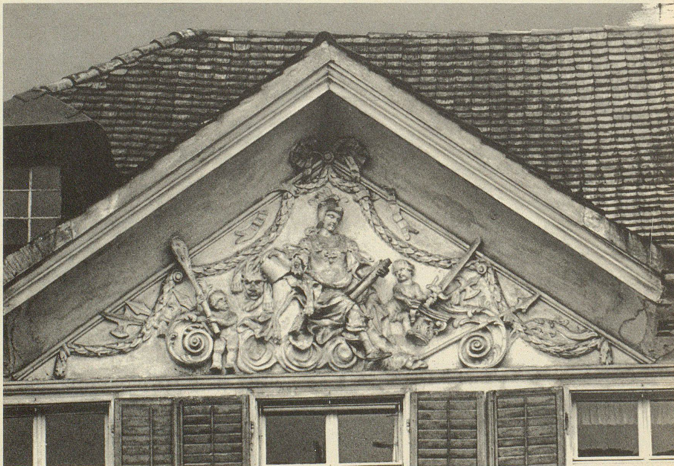
Giebelstukkaturen, den Krieg darstellend.

beiden Türen an der Südfront zieren. Kraftstrotzende Löwen beschirmen die von einer Krone überhöhten Wappenschilder. Ein ebenso gewichtiger Löwenkopf aus Messing mit dem durch das Maul gezogenen Schlagring prangt an der östlichen Türe als selten gewordener, wenn auch nicht mehr benützter Klopfer. Daneben verleihen figürliche Stukkdekorationen an der West- und Ostseite (darunter das Medaillon des Erbauers) dem ganzen Haus ein überaus festliches Gepräge, das durch den hellen Farbanstrich des Holztäfers bzw. des Verputzes noch unterstrichen wird. Erwähnenswert sind aber auch das prächtige schmiedeiserne Hoftor und das Balkongeländer auf der Ostseite, die anlässlich der Renovation in sehr erfreulicher Weise wieder angebracht worden sind. So präsentiert sich heute der imponierende Bau als prächtiges Schmuckstück am Dorfplatz in Herisau.