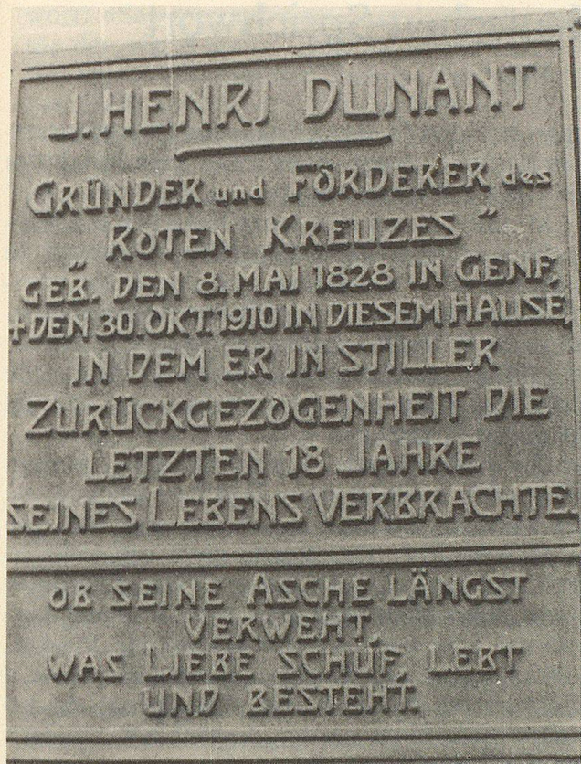
Eine Bronzetafel am alten Bezirkskrankenhaus Heiden erinnert an den grossen Schweizer, der hier seine letzten 18 Lebensjahre verbracht hatte und hier starb.