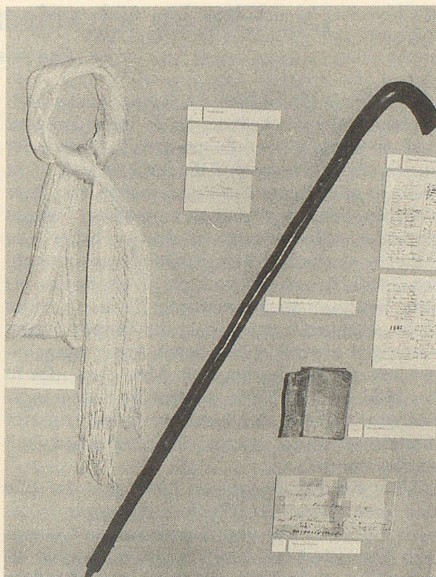
Einige persönliche Gegenstände aus Henry Dunants bescheidenem Besitz, seine Visitenkarte, sein Handstock und das oft gebrauchte Wörterbuch sind in einer separaten Vitrine ausgestellt.

lung von Schriften im Museum vor, hatten aber eine Gedenkstätte erwartet und sich oft entsprechend geäussert.