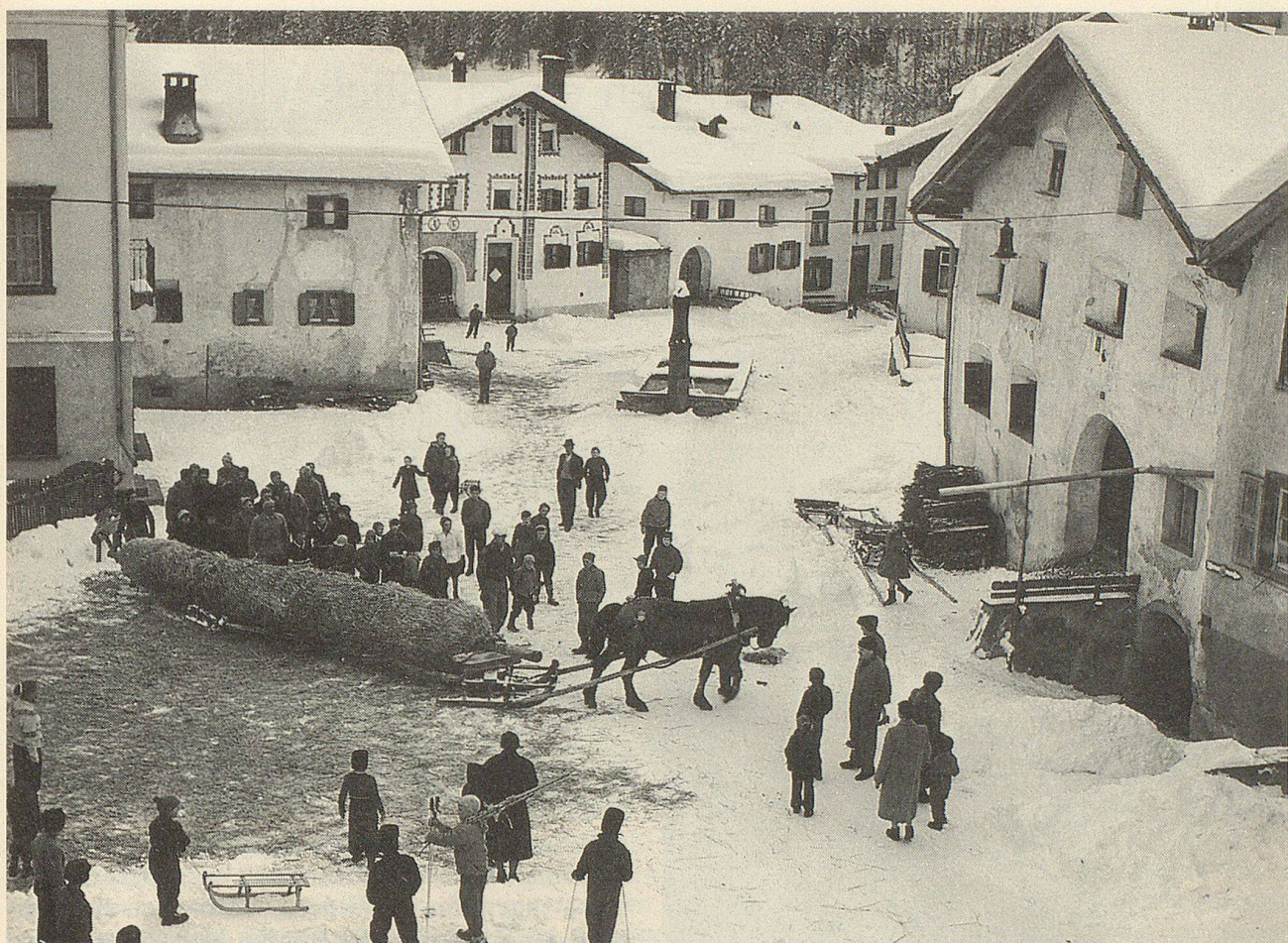
Der Strohmann ist verladen und wird an seinen Standort über dem Dorf geführt, wo er alljährlich am ersten Februar-Sonntag verbrannt wird.

Jung und alt schauen diesem feierlichen Akt zu, und wenn die Pferde angespannt sind, wird die Fuhre zum Verbrennungsplatz gebracht, und das in einem langen frohen und heiteren Zug. Aber man bedenke auch, was für eine Mühe das Aufstellen macht! Das bedingt grösste Vorsicht, und wird denn auch von erfahrenen Männern besorgt.