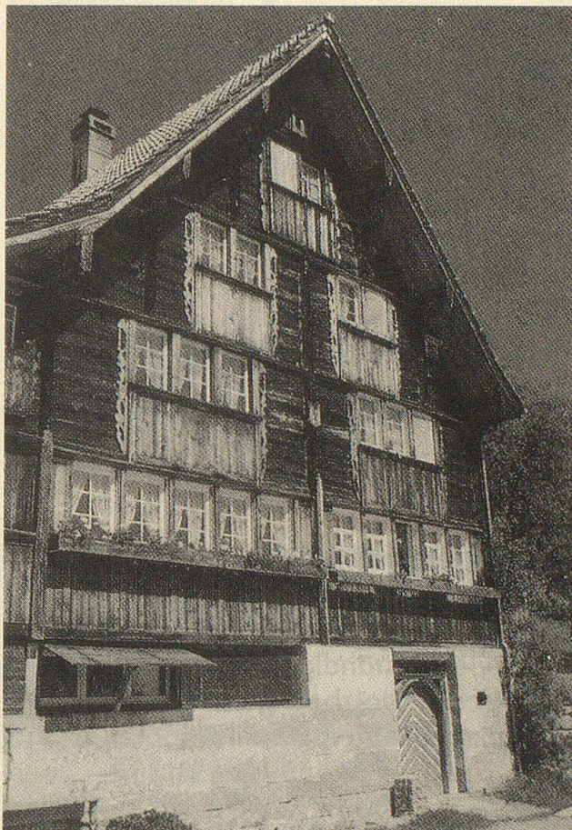
Heiden/Schwendi, Weinbauernhaus, 1761. (Objekt Nr. 82)

Ausserrhoden ist 1989 um eine Attraktion reicher geworden: nämlich um einen 84 km langen kulturhistorischen Wanderweg, der zwischen Urnäsch und Rheineck quer durch den ganzen Kanton an 85 interessanten Kulturobjekten vor-