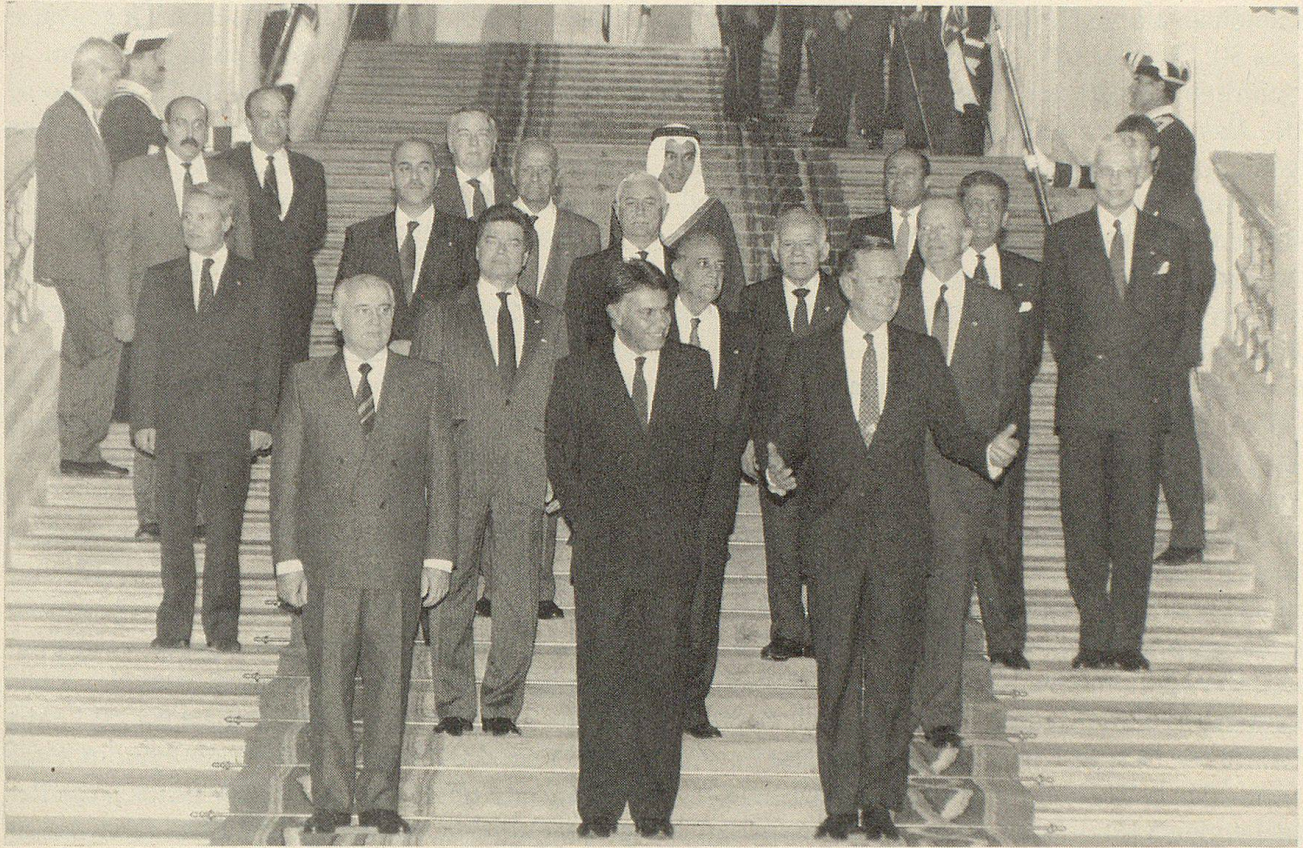
Friedenszeichen in Madrid: Unter der Schirmherrschaft der USA und der Sowjetunion versammelten sich Israel und die arabischen Nachbarstaaten an einen gemeinsamen Tisch.

Entwicklung war zweifellos auch die weit verbreitete Ernüchterung über Schwierigkeiten und Kosten der deutschen Wiedervereinigung. Abnützungerscheinungen der Regierungskoalition in Bonn offenbarte auch der Rücktritt Außenminister Hans-Dietrich Genschers, der das Auswärtige Amt während 18 Jahren geleitet hatte. – Schwere Verluste musste in Italien die regierende Viererkoalition hinnehmen. Christlichdemokraten, Sozialisten, Sozialdemokraten und Liberale kamen bei den Parlamentswahlen vom 5./6. April nur noch auf 48 Prozent (1987: 53,7 Prozent). Als eindeutige Siegerin ging die Lega Nord hervor, die mit ihrem Eintreten für regionale Autonomie rund 9 Prozent der Stimmen gewinnen konnte. – Im Inselkönigreich Grossbritannien gingen die Uhren wieder einmal anders als auf