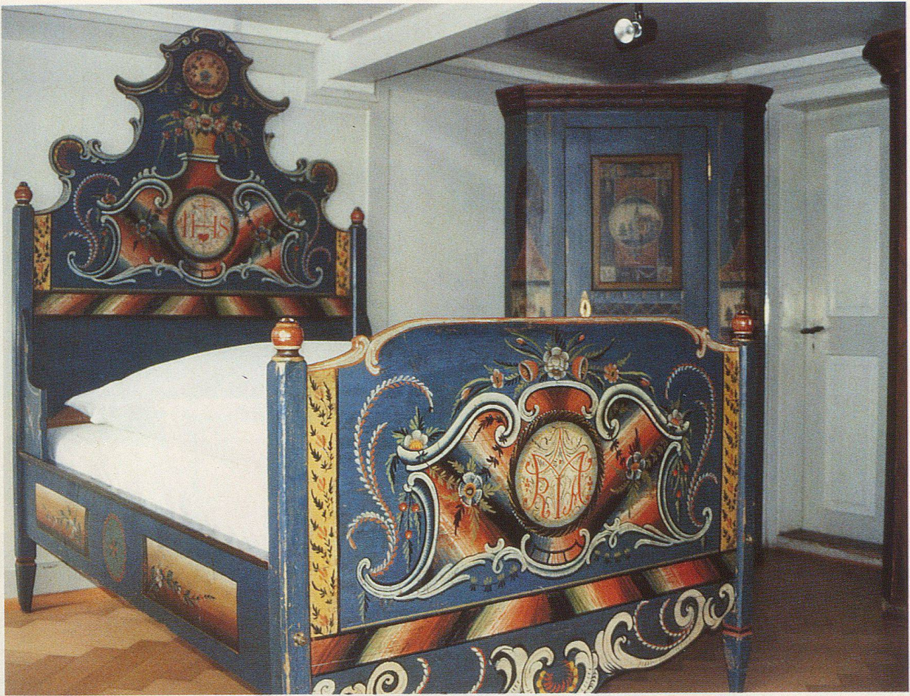
Von Hansruedi Stuber restaurierte Stilmöbel: Ein mit religiösen Motiven bemaltes Empire-Bett (1827) und Schrank aus Appenzell Innerrhoden.