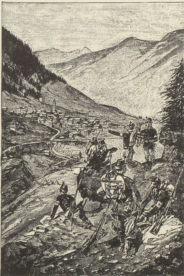
Rekognoszierende Schützen bei Airolo.

Der Autor zählt schliesslich die zahlreichen Festungen auf, etwa das zu jener Zeit gerade fertiggestellte Fort Fondo del Bosco oberhalb Airolo, «das mit seinen 12 cm Kanonen und Mörsern im Stande sein dürfte, einem von Süden herkommenden Eindringling den Weg zu verlegen». Im Artikel ist ferner die Rede vom Werk Motte Bartola (für Infanterie und Artillerie eingerichtet) ebenfalls südlich des Gotthards und auf der Nordseite, oberhalb von Andermatt, von den beiden dominierenden Werken Bühl und Bätzberg, «beide in Felsen gesprengt und deshalb vom Gegner schwer zu entdecken», sowie von den im Bau befindlichen Panzertürmen in der Nähe des Hospizes. – Neben den kleineren Werken am Oberalp und an der