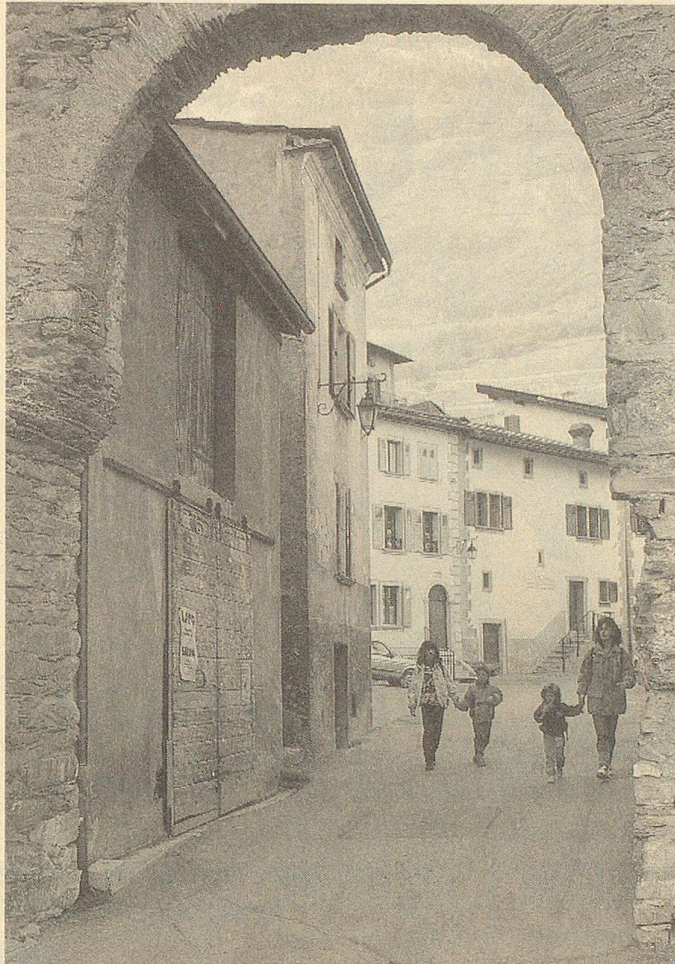
Saillon im sonnigen Wallis – die Heimat von Fälschmünzer Farinet.

späteren Anfertigung von Werken im Stil eines alten Meisters der Fall klar. Bei Fälschungen im Kunsthandel ist weniger das genaue Kopieren (wie bei Banknoten) gefragt, sondern die Imitation mit Imagination: Kunstfälscher müssen sich in vergangene Jahrhunderte zurückversetzen, handwerkliches Geschick mit historischen Kenntnissen verbinden. Gelingt die Fälschung perfekt, ist sie ihrerseits ein kleines Meisterwerk.