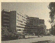
St. Gallen: Stadt im grünen Ring