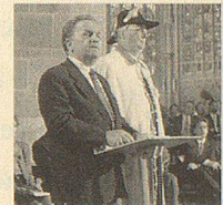
Gedenkanlass 50. Jahrestag des Weltkriegsendes