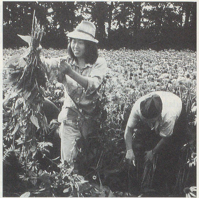
Der Rote Sonnenhut (lat. Echinacea purpurea ) bildet den Hauptwirkstoff des A.-Vogel-Mittels Echinaforce – dem bekannten und bewährten Frischpflanzenpräparat zur Stärkung der Abwehrkräfte bei Infektionskrankheiten. Das Bild zeigt die Echinacea-Ernte der Bioforce AG in Roggwil.

bührt. Ehrungen blieben schliesslich aber nicht aus: 1952 wurde ihm die Ehrendoktorwürde für medizinische Botanik der University of California, Los Angeles, verliehen, und 1982 erhielt er in Anerkennung seiner Verdienste um die Naturheilkunde die Priessnitz-Medaille der Deutschen Heilpraktikerschaft. Seit 1984 ist er Ehrenmitglied der SAGEM, der Schweizerischen Ärztesellschaft für Erfahrungsmedizin.