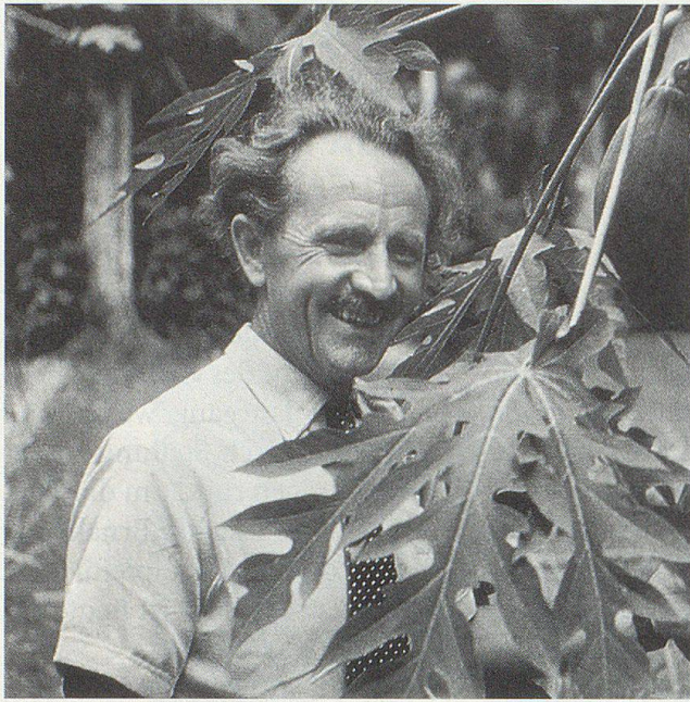
Mit dem Eigenanbau und der Entdeckung der Wirkungskräfte in der frischen Pflanze begann alles. Der «Naturmensch Alfred Vogel» auf einer seiner vielen Reisen: Aus der gottgegebenen Natur schöpft er die Kraft, die er an die Menschen weitergibt.