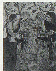
Salpetersieden im Appenzeller- land