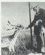
Wildpark Peter und Paul